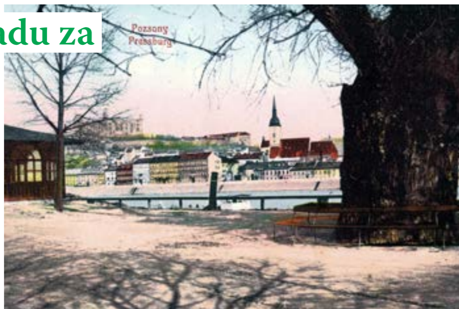
▲ Napoleonov topol na pohľadnici z roku 1907

Na dnešnom Tyršovom nábreží v blízkosti prístaviska niekdajšieho propelera rástol, zrejme už od 20. rokov 18. storočia, topol čierny. Podľa tradície sa na tomto mieste v rámci svojej návštevy Prešporka, ktorá sa uskutočnila 31. augusta 1809, zastavil cisár Napoleon a spod koruny topola hľadel na mesto. Strom sa stal neskôr známym ako Napoleonov topol.