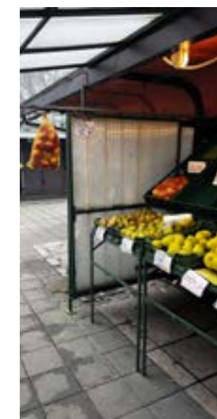
▲ „Bočné zábrany proti vetru by nám asi na novom trhovisku nepovolili,“ obáva sa trhovníčka.