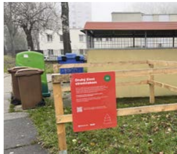
▲ Novoročná mulčovačka sa bude konať 24. januára na Námestí republiky od 10h do 14h.