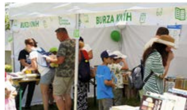
▲ Knižný svet na Dňoch Petržalky.

▲ Sťahovať do nových priestorov sa bude pobočka na Prokofievovej a jej 30-tisícový knižničný fond.