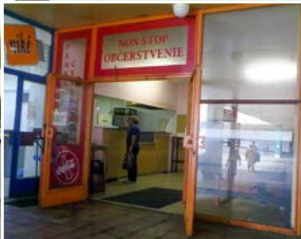
▲ Pred štyrmi rokmi prišlo nútené sťahovanie. Síce len o pár metrov, ale do podstatne menších priestorov. Skončili spoločne diskusie pri pulte a niekto mal problém presun o osem metrov aj zaregistrovať.