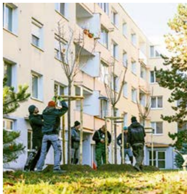
▲ Rekordná jesenná výsadba v roku 2025.