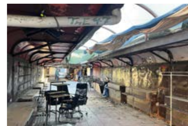
▲ Prestavba trhoviska bude zrejme na etapy, aby neodradili trhovníkov. Termín zatiaľ známy nie je.