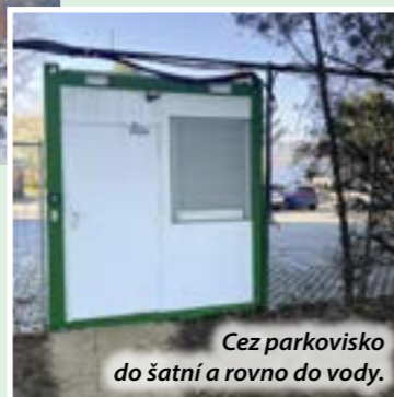
Cez parkovisko do šatní a rovno do vody.

Hádam každú zimu, keď sme sa zhovárali s otužilcami na Draždiaku, spomenuli, že by privítali podobné zázemie, aké je napríklad na Zlatých pieskoch. Prezliekali sa totiž na lavičkách pri zariadenom bufete a najmä, keď vyšli z vody a fúkalo, to bolo drsné. Petržalka reflektovala na ich potreby a pri Veolia aréne osadila kontajner, v ktorom sa môžu prezliecť a v uzamykateľných skrinkách si odložiť veci. Aj s možnosťou zaparkovať ich to vyjde len na 50 centov za hodinu.