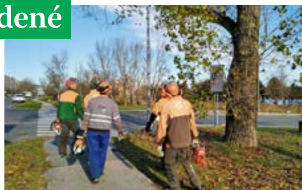
▲ Petržalka sa posledné roky zbavuje invazívnych stromov.