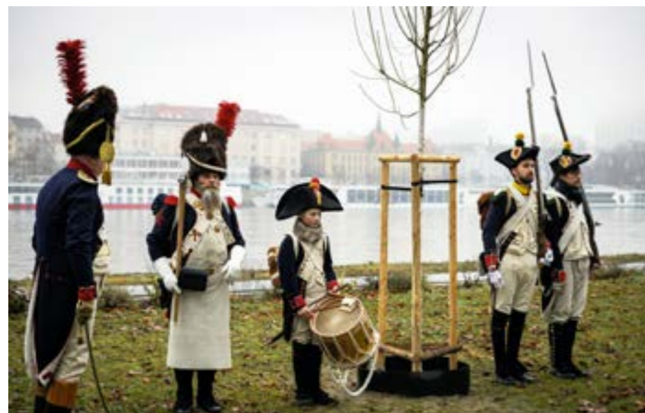
▲ Novovysadený topol čierny na Tyršovom nábreží

Mgr. Matej Čapo, PhD