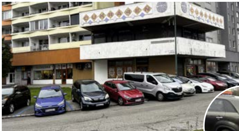
▲ Na Námestí Hraničiarov sa aktuálne kolmo parkuje na chodníku, často až do zelene.

Na úvod treba povedať, že online prerokovanie bolo kultivované, projektanti PAAS odpovedali na väčšinu otázok a boli ústretoví upravovať projekt na základe podnetov obyvateľov. Niekoľkokrát ich dokonca vyzvali, aby, ak majú napríklad tip na miesto pre cik-cak čiary pre dočasné zastavenie, neváhali sa oň podeliť.