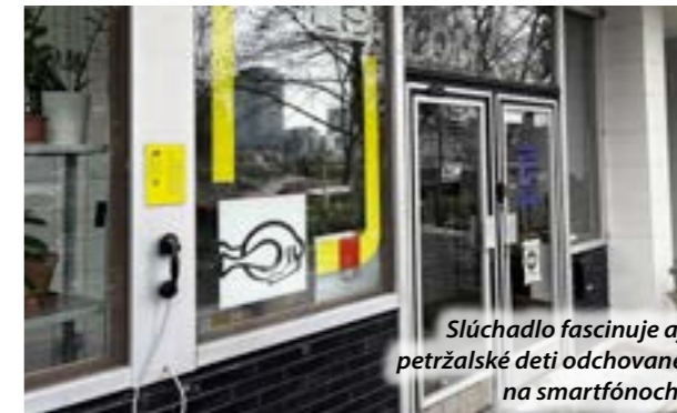
Slúchadlo fascinuje aj petržalské deti odchované na smartfónoch.

Na terase na Mlynarovičovej priamo pred priestorom LOM-u nemôžete prehliadnúť slúchadlo upevnené na stene. Zdvihnite ho a započúvajte sa.