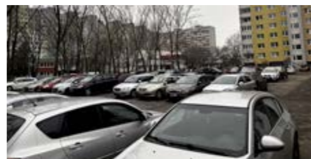
▲ Plochu na Osuského premení mestská časť na oficiálne parkovisko za cca 500-tisíc eur.