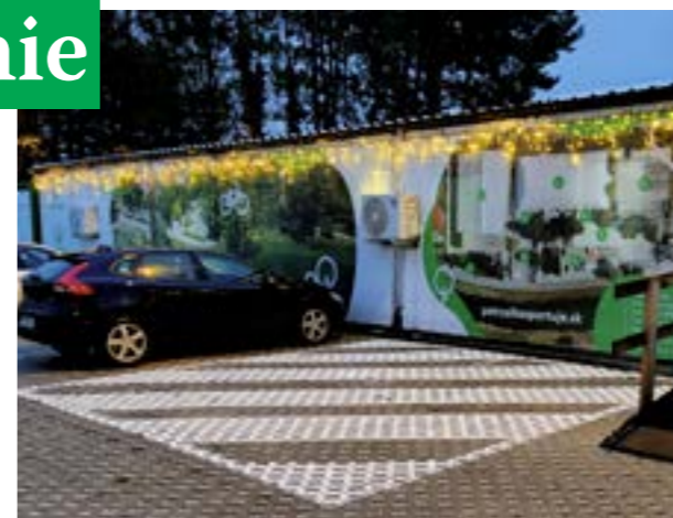
▲ Vysvietené klzisko pri Draždiaku.