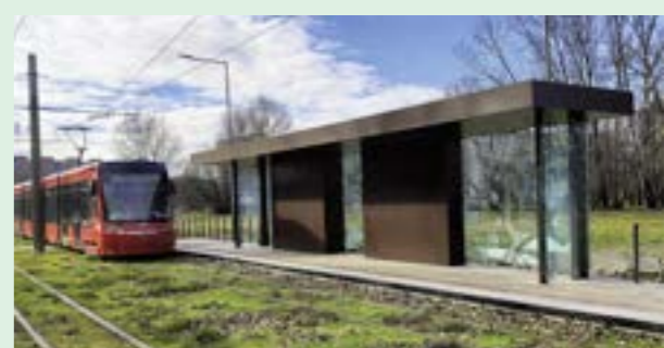
▲ Rozbité nové presklenie na zastávke Gessayova bolo neohodou pri montáži, nie vandalizmom.

Pokračujú aj práce na ďalších stavebných objektoch.