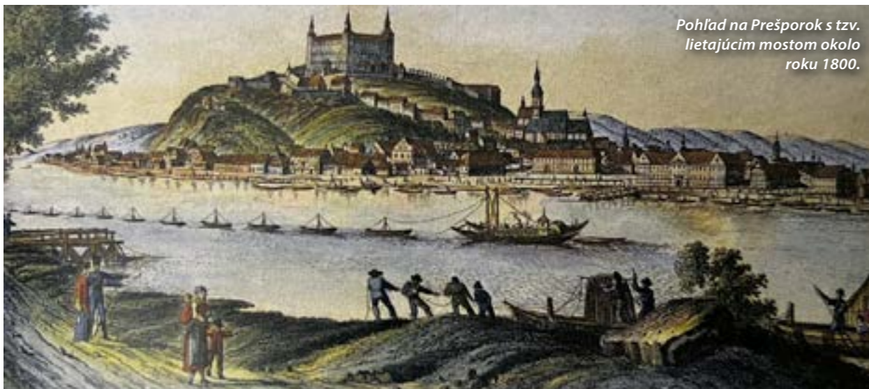
Pohľad na Prešporok s tzv. lietajúcim mostom okolo roku 1800.