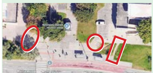
▲ Vpravo by mal byť vjazd a výjazd pre ZTP.

V rámci rekonštrukcie schodiska je v pláne oprava nášlapných častí schodov, vytvorenie bezbariérového prístupu (dve tretiny schody, jedna tretina rampa), ušľachť sa posúdi jeho stav a podľa toho sa zvolí riešenie – buď výmena, alebo náter. K Šustekovej mestská časť oddržala od magistrátu súhlasné stanovisko, v ktorom si ale mesto žiada ďalšie vyjadrenia a povolenia, preto je realizácia možná až na budúci rok. (in) foto: archív M. V.