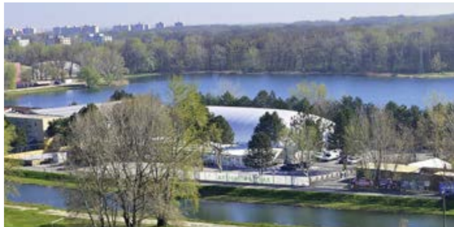
▲ Od apríla funguje v nafukovacej hale pri Veľkom Draždiaku klzisko Veolia Aréna Draždiak.

■ Júnové Dni Petržalky sa presťahovali z dostihovej dráhy do areálu Ekonomickej univerzity a predĺžili sa na štyri dni. V júni sme sa dozvedeli aj veľmi potešujúcu správu, že sa petržalský úrad rozhodol