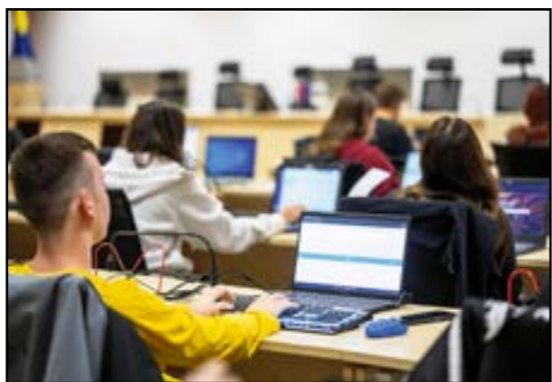
Nový systém otestujú rodičia budúcich stredoškôlkov.

najmenej preferovanú a systém následne pracuje s poradiem uchádzačov, kapacitami škôl a zákonnými kritériami prijímania. Takýto prístup zabraňuje situáciám, keď dieťa získa miesto na viacerých školách naraz a blokuje kapacity ostatným uchádzačom. Ak sa dieťa dostane na školu s vyššou prioritou, systém automaticky uvoľní miesta na menej preferovaných školách ďalším deťom.