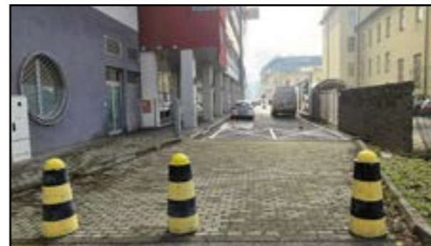
Po novom je už Satinského ulica priechodná pre chodcov, naďalej však zostáva neprejazdná pre vozidlá.