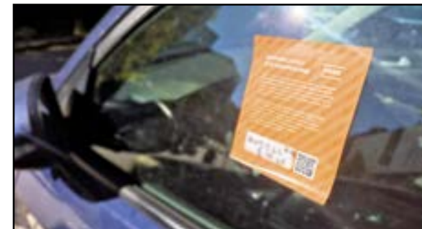
Mesto chce prvý prehršok pri parkovaní riešiť bez pokuty.

Zmeny sa majú dotknúť aj cestujúcich v MHD, kde sa po poslednej úprave 1. júna 2025 pokuta navýšila až na 120 eur (resp. 99 eur pri úhrade na mieste alebo do 10 pracovných dní). To je takisto jedna z najvyšších sadzieb pri cestovaní bez platného lístka v porovnaní s podobnými mestami. V Prahe je napríklad od začiatku roka horná hranica pokuty 2000 korún, teda približne 82 eur a predtým to bolo dokonca len 1500 korún. Kým v českej metropole pristúpili k zvýšeniu pokuty, náš magistrát volí opačný prístup. Navrhuje, aby po novom bola maximálna výška pokuty 99 eur, resp. o 20 eur menej pri úhrade na