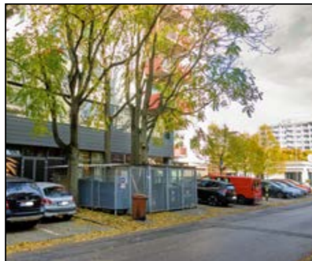
DNES: Darnicu (neskôr Átrium) nahradil polyfunkčný dom.

stredisko hier, polikliniku, domov dôchodcov a ďalšie dôležité objekty spoločenskej potreby...“ V Darnici bývalo živo, chodievali sem deti i dospelí nielen z Ružinova, ale aj z iných častí mesta. Fungovali tu kluby a rôzne krúžky, mnohých prilákali filmové predstavenia, výstavy, literárno-hudobné pásma či diskotéky. Budova, ktorá slúžila ako „dom československo-sovietskeho priateľstva“, dostala po novembri 1989 nový názov Átrium. Jej osud