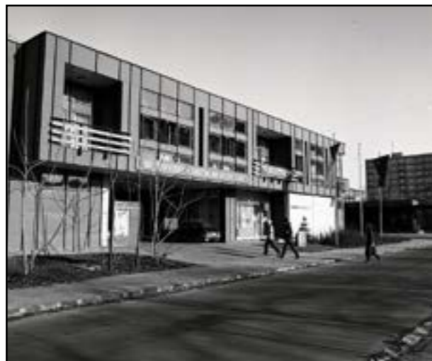
ROK 1976: Na Štrkoveci v Ružinove sa buduje klub družby Darnica...