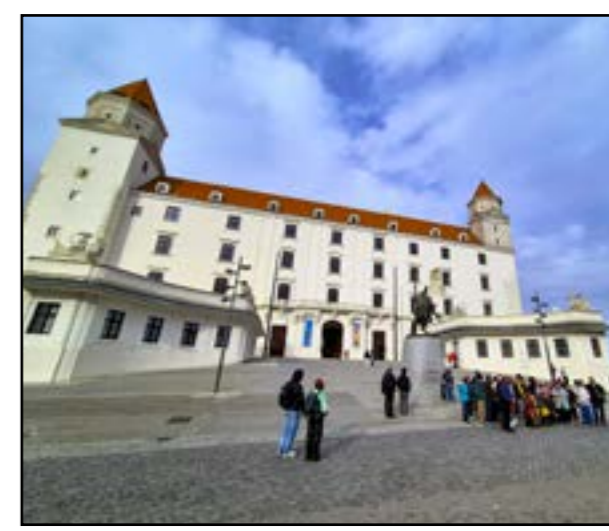
Turisti u nás oceňujú aj krátke vzdialenosti medzi atrakciami.

Výber destinácií na rok 2026 vznikol na základe rozsiahleho výskumu, dátových analýz a hlasovania čitateľov. Odzrkadľuje preferencie britských cestovateľov, ktorým domínujú najmä krátke letecké vzdialenosti, pobyty pri mori a autentické kultúrne zážitky. Práve tie by mali turistov lákať aj ku nám. „Bratislava, ležiaca na brehoch Dunaja, je známa svojím stredovekým