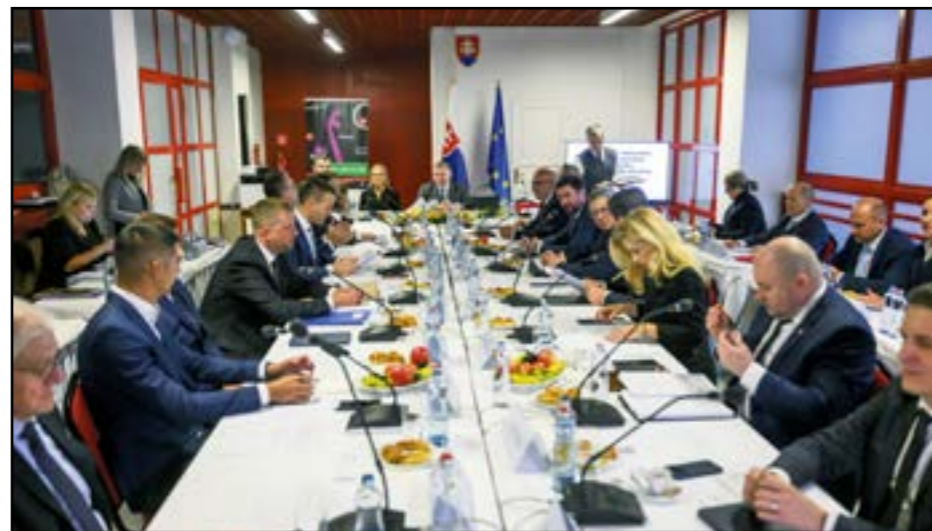
Debata bola podľa starostu Ružinova konštruktívna.