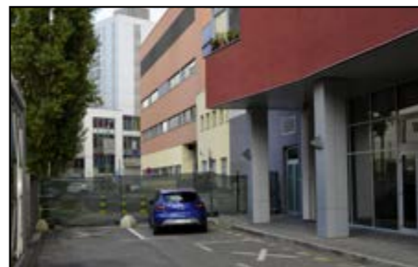
Najskôr ulicu prehradili pletivom a kužeľmi, potom kovovým plotom.