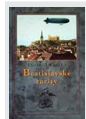
Spracované podľa knihy Igora Janotu Bratislavské rarity, Vydavateľstvo Marenčin PT, so súhlasom vydavateľstva

1813 sa na rieke vytvoril taký hrubý ľad, že sa aj vtedy dalo po nej prechádzať s naloženými vozmi. A starší Bratislavčania si iste pamätajú i zimu v roku 1963, kedy mala rieka opäť mimoriadne hrubú ľadovú prikrývku, takže vodohospodári museli zabezpečiť stály nočný i denný dohľad. Na najrizikovejších úsekoch boli dokonca rádiové hliadky, aby v prípade hrozacej ľadovej povodne upozornili na nebezpečenstvo vtedajšiu protipovodňovú komisiu. (bn)