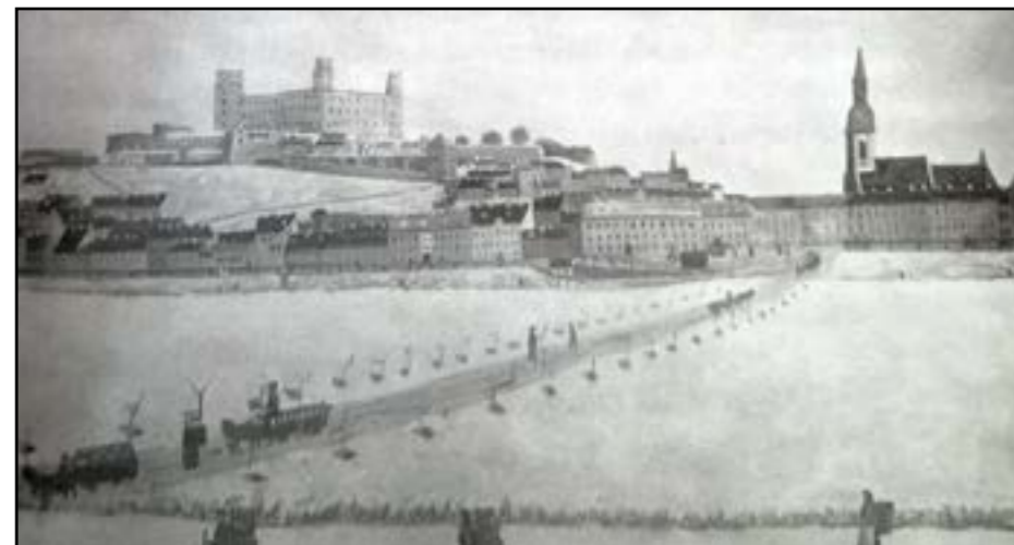
Nákres „ľadového mosta“ od neznámeho autora okolo roku 1890

Prvý upravený prichod cez zamrznutú rieku, nazývaný Eisweg - ľadová cesta, sa v kronikách spomína v roku 1595. Pripravili ho tak, že na ľad kladli slamu a poliali ju vodou, aby k ľadu prmrzla a nešmýkalo sa po ňom. Od vtedy sa stal prechod po ľade nielen potrebou, ale aj akousi zimnou slávnosťou, spojenou so zábavou, spoločenskou udalosťou, ktorú ľudia vy-