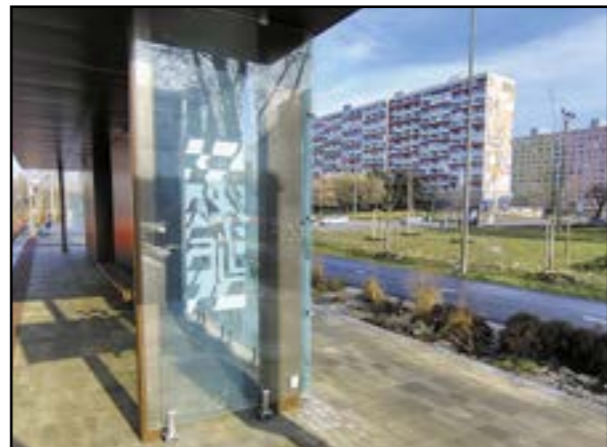
Zastávka Zrkadlový háj s dizajnom, ktorý odkazuje na maľbu Mier na Osuského ulici (vzadu).

Hoci nová električková trať v Petržalke slúži svojmu účelu už od konca júla 2025, v okolí trate stále prebiehajú stavebné práce. Mesto však predpokladá, že minimálne prístrešky budú dokončené do konca februára. A nie len tak hocikak! Pozorným cestujúcim určite neuniklo, že zasklenie zastávok odkazuje na petržalské monumentálne maľby, ktoré kedysi zdobili vybrané paneláky. „Tieto veľkoformátové diela na stenách panelákov mali nielen estetický účel, ale plnili aj orientačnú funkciu - a obe tieto funkcie im svojim spôsobom prinavracia aj dizajn prístreškov,“ pripomenul na