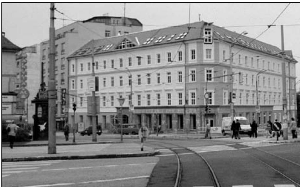
V priestoroch bývalej Mestskej knižnice na rohu Obchodnej ulice bola kedysi Moravská banka.