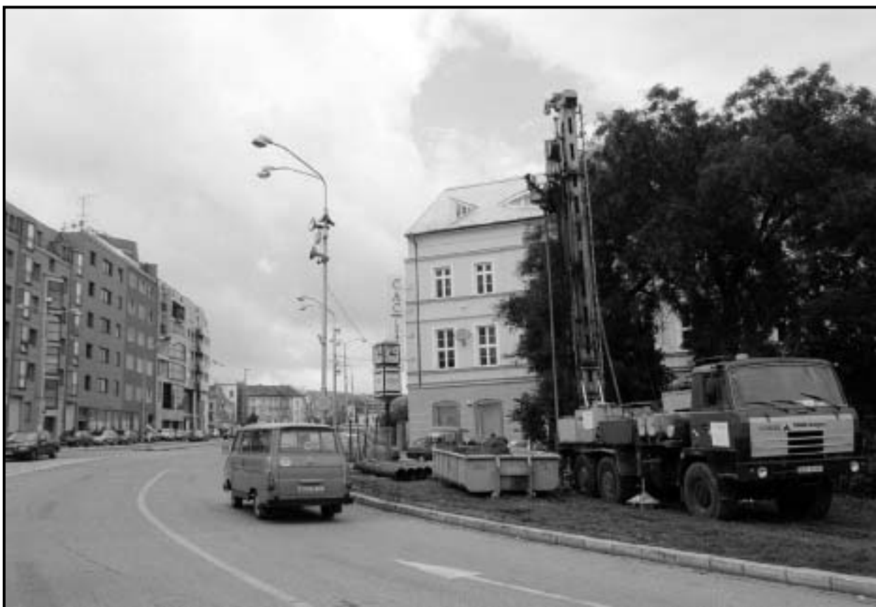
Na Hurbanom námestí, podobne ako aj na Námestí SNP sú od augusta takéto vrtné súpravy, ktorú tu uskutočňujú geologický a hydrogeologický prieskum podložja oboch námestí. Ide súčasť predprojektovú prípravu revitalizácie Námestia SNP, ktorú realizuje mestská časť Staré Mesto.

Bratislavčania, ktorí počas víkendu „zablúdia“ do centra mesta, si budú môcť prezrieť prácu zručných remeselníkov a ich výrobky z prútia, kože, šupolia, dreva či hliny. Vyhrávať budú skupiny Schrammel Quartet, Ragtime Jazz Band, Piešťanský diexeland a Funny Fellows. Na Františkánskom námestí budú bratislavskí obchodníci ponúkať husacinu, lokše, cigánsku pečienku, moravské koláče, pečené gaštany a ďalšie dobroty. Chýbať nebude ani burčiak, ktorý neodmysliteľne patrí k Bratislave ako jednému z centier vinohradníctva na Slovensku. Zostáva veriť, že tentoraz bude bratislavským Trhom cechov priat' aj počasie, ktoré sa počas uplynulých dvoch víkendov správalo nevlúdne. (brn)