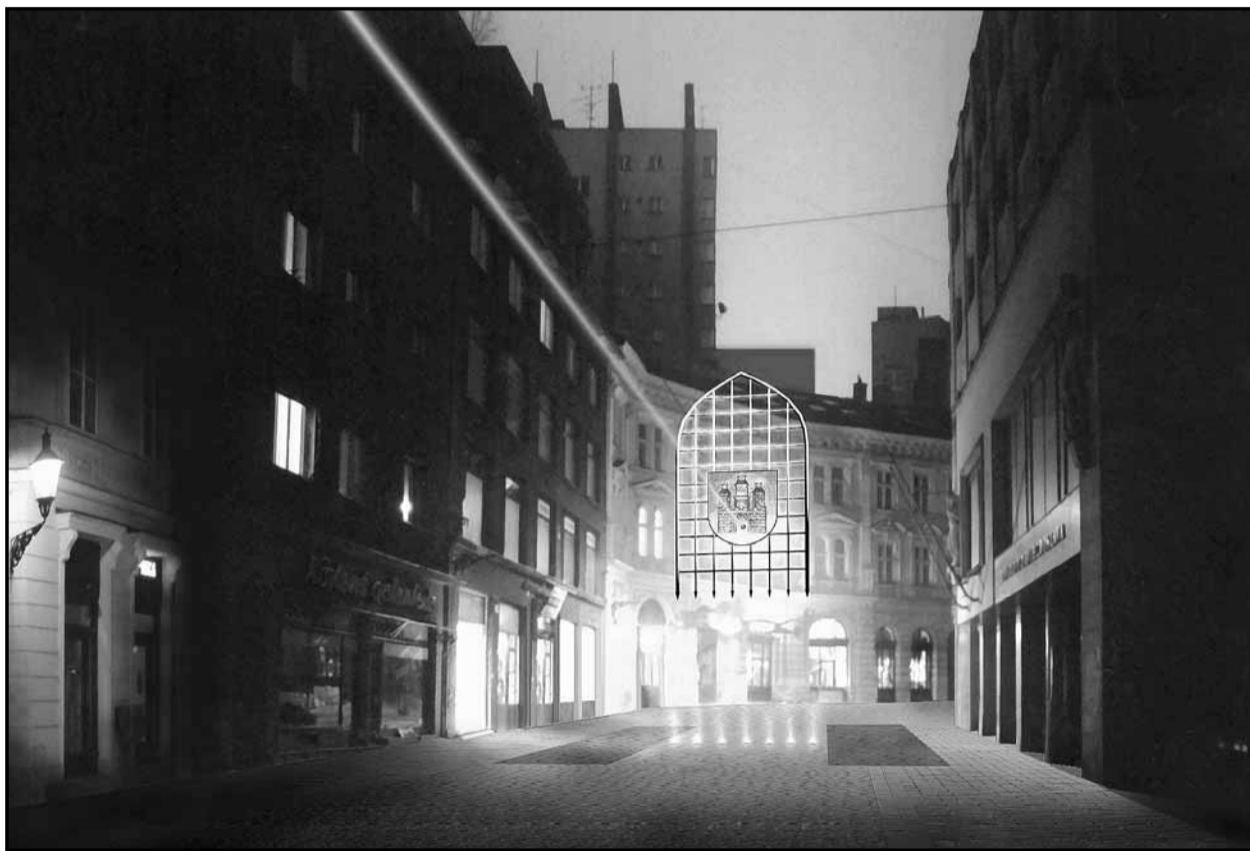
Predpokladaná poloha Laurinskej brány bude v bratislavskej pešej zóne prezentovaná v priestore pred DPOH. Pôjde o unikátne svetelno-laserové dotvorenie zrekonštruovanej ulice. (Viac čítajte na 3. strane) VIZUALIZÁCIA - I. Rumler