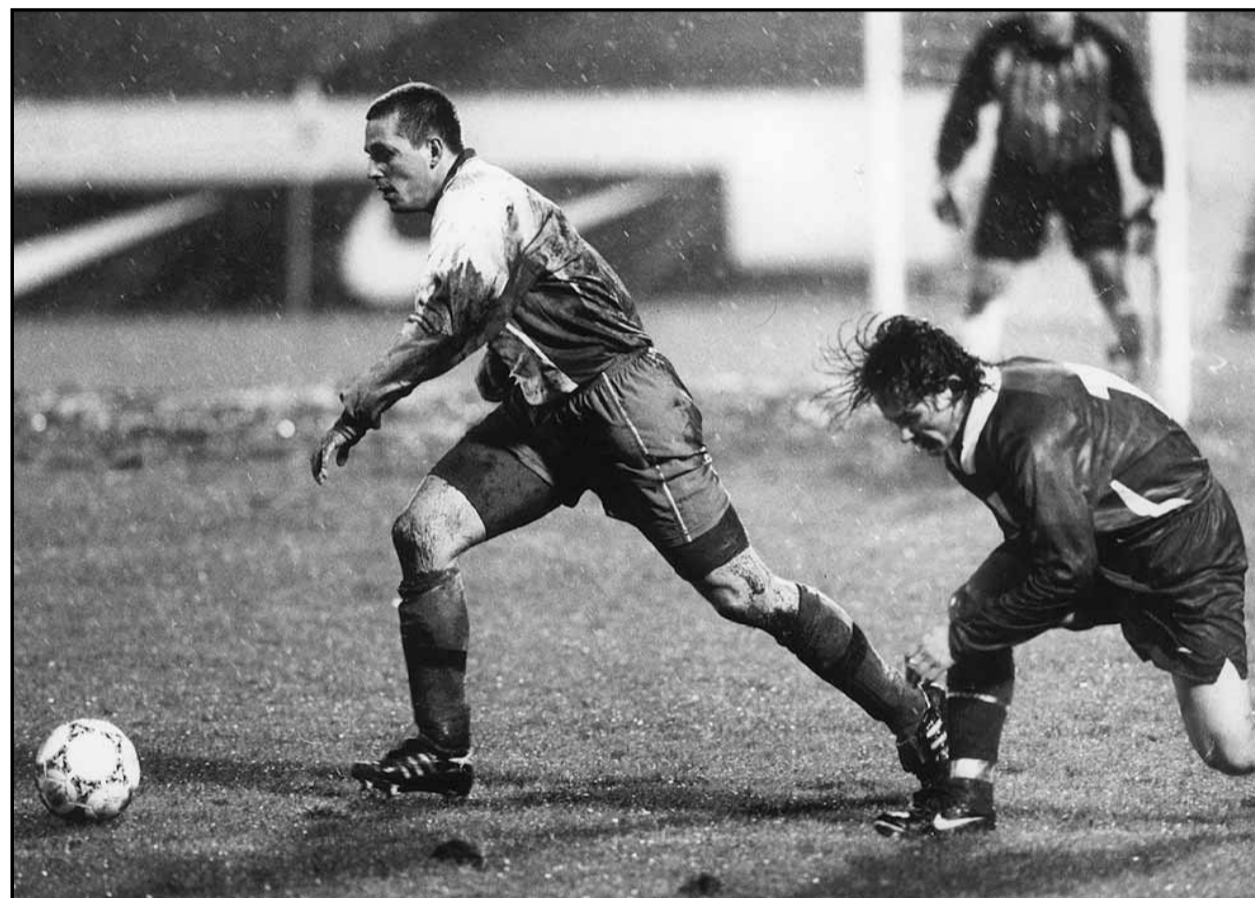
Symbolický záver reprezentačnej jesene, Majoroš ide do kolien, súper dopredu.