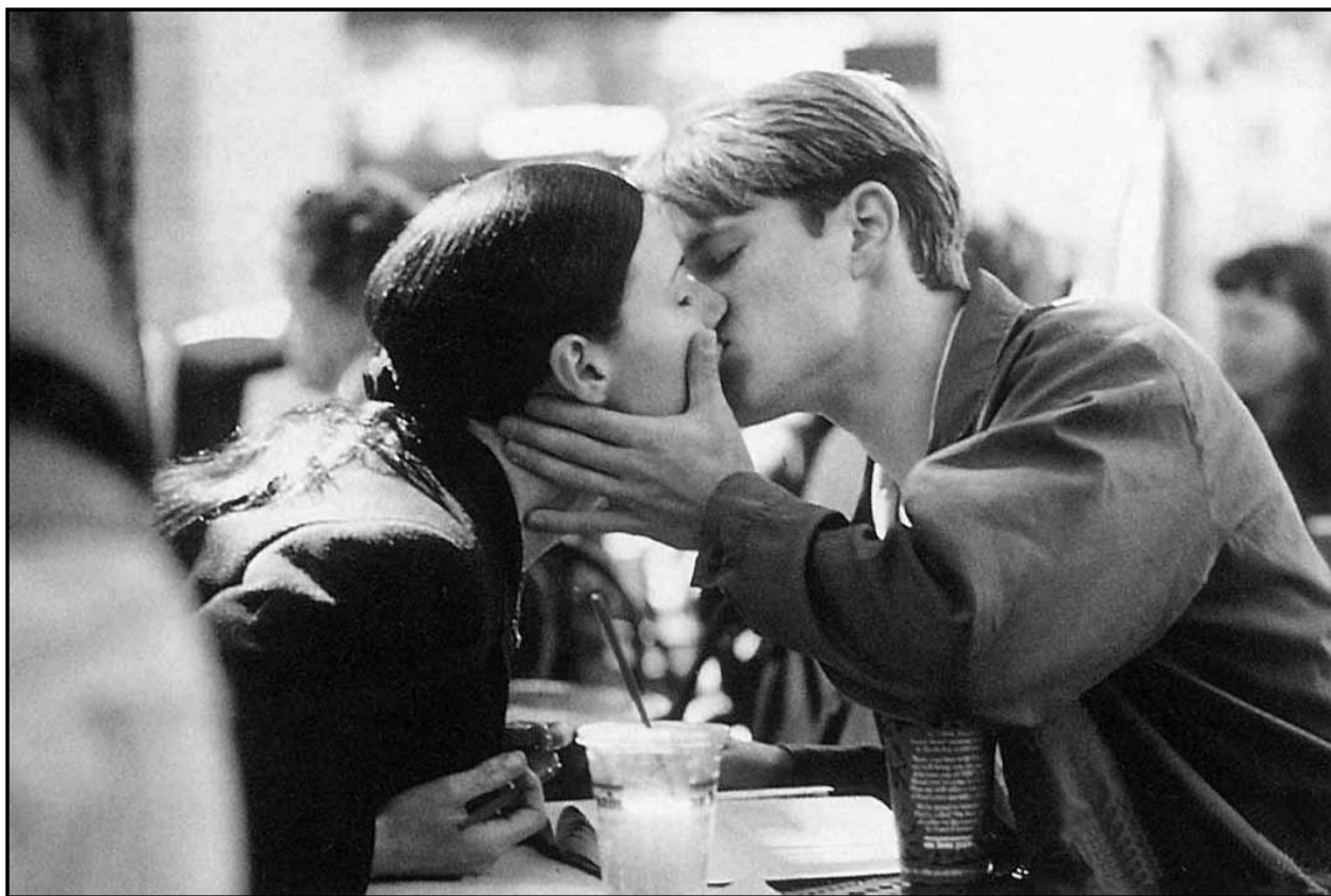
Dobry Will Hunting sa presvedčí, že láska je cennejšie ako večné potľkanie sa a riešenie neriešiteľných matematických príkladov.

Bratislavské Noviny najbližšie vyjdú 10. 12.