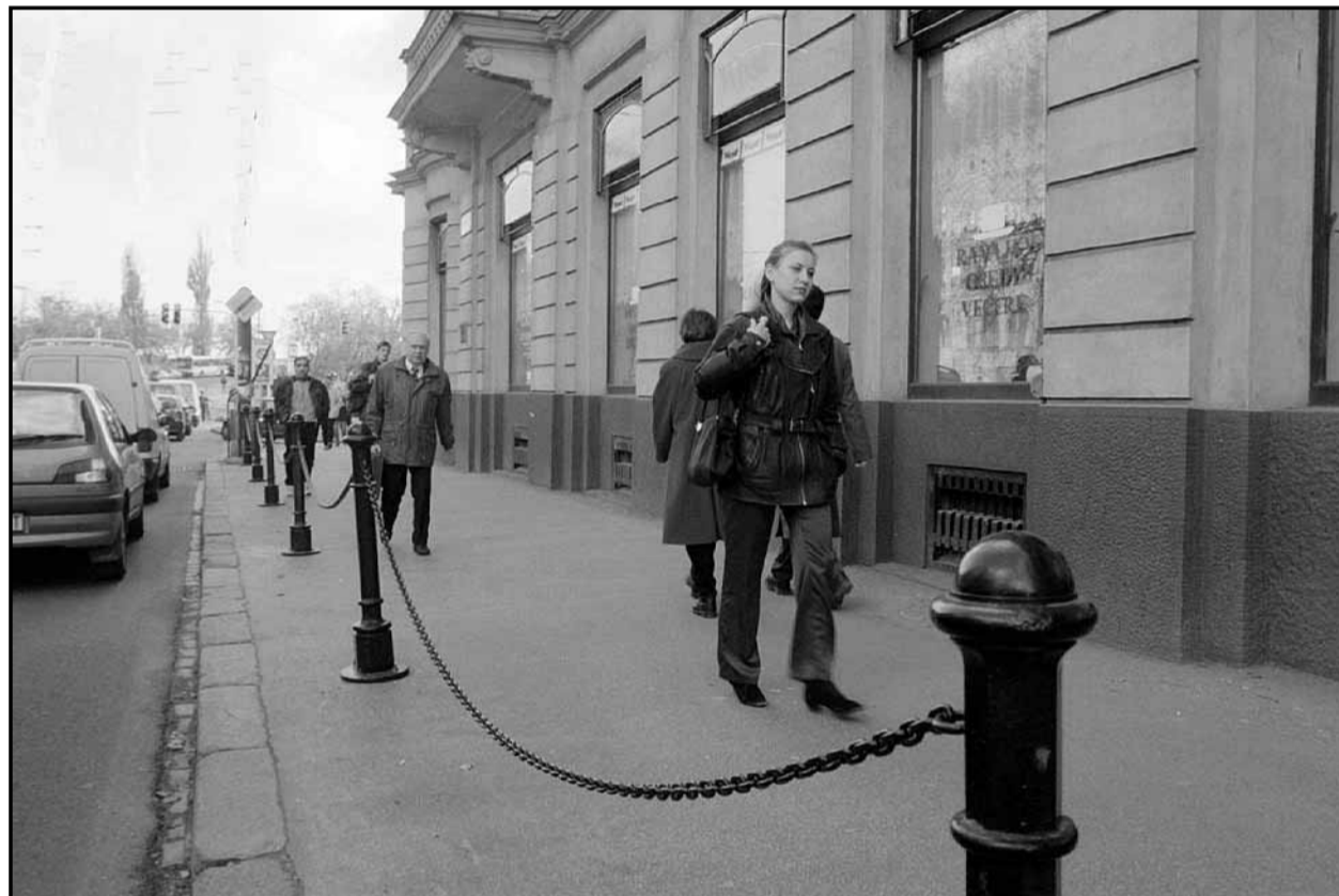
Z iniciatívy majiteľa hotela Krym na Šafárikovom námestí boli na chodníku osadené tieto praktické stĺpiky. Chodci tak už nemusia obchádzať odparkované autá bezohľadných vodičov. Podobný prístup by sa uplatnil aj v iných častiach Bratislavy, najmä však v jej centre.

Za primátora, resp. starostu je zvolený kandidát, ktorý získal najväčší počet platných hlasov. Pri rovnosti hlasov sa vykonajú nové voľby. (brn)