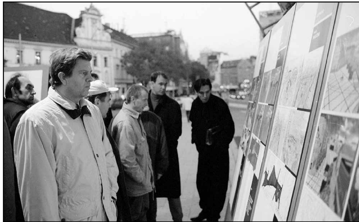
Bratislavčanov vystavené projekty Revitalizácie Námestia SNP očividne zaujali.