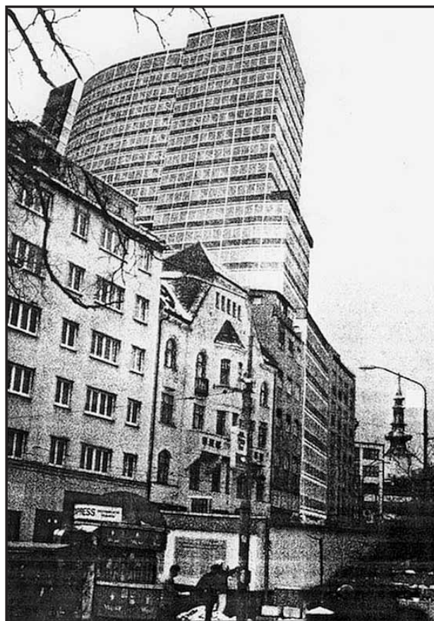
Podľa novej architektonickej štúdie by mal na Námestí SNP vyrásť takýto mrakodrap.

Ekumenické služby božie sa na verejnom priestranstve organizujú pri mimoriadnych príležitostiach všeobecného významu. V Bratislave sa tieto slávnostné služby uskutočnili už 17. októbra 1619 v Dóme sv. Martina za účasti troch cirkví: katolíckej, evanjelickej a kalvínskej. Začatím ich novej tradície na Nový rok organizátori nadväzujú na historický fakt, ktorý však o niekoľko storočí predbehol vývoj vo svete. V rámci rímskokatolíckej cirkvi sa totiž možnosti ekumenie otvorili až po druhom vatikánskom koncile a Ekumenickom direktóriu v roku 1967. (brn)