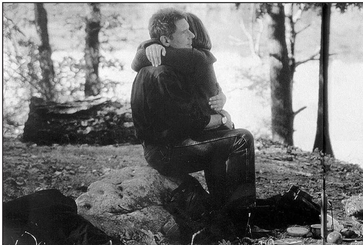
Skvelé výkony vo filme Náhodné stretnutie podali Kristin Scott Thomasová a Harrison Ford.