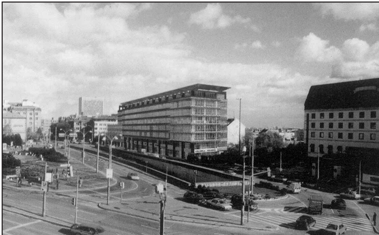
Takto má vyzerať nový objekt medzi Vysokou ulicou a Hoddžovým námestím.

Jedno z odporúčaní vychádza z tézy, že práve tí, ktorí sa najviac priamo starajú o starých ľudí doma, sú na tento účel najmenej školení alebo majú nedostatočnú kvalifikáciu. Magistrát hlavného mesta SR Bratislava sa teraz rozhodol tento nedostatok postupne odstraňovať. Pre všetkých záujemcov ponúka základný tréning, ktorý bude zameraný na výkon úloh pri práci so staršími spoluobčanmi doma a na spoluprácu s pracovníkmi zdravotníckych a sociálnych zariadení. Základný tréning zabezpečí oddelenie sociálnych vecí magistrátu. Záujemcovia sa môžu prihlásiť na telefónnom čísle 5935 6215 alebo 5935 6228 až do konca marca. (miv)