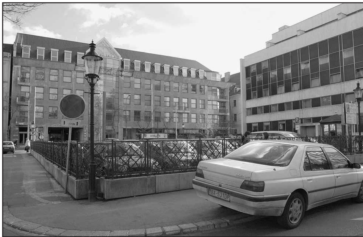
Komenského námestie je dnes vlastne jedným parkoviskom. Zmení sa to?

V nočných hodinách (od 22. do 10. hodiny) majú vjazd a výjazd bez osobitného oprávnenia povolený obyvatelia a podnikatelia so sídlom v pešej zóne, zásobovanie, taxislužba a vozidlá prepravujúce osoby ťažko zdravotne alebo pohybovo postihnuté. Oprávnenia sa vydávajú maximálne na jeden rok. Platnosť oprávnení, ktoré doteraz vydala Bratislavská parkovacia služba, sa končí dňom 31. decembra 2000. (miv)