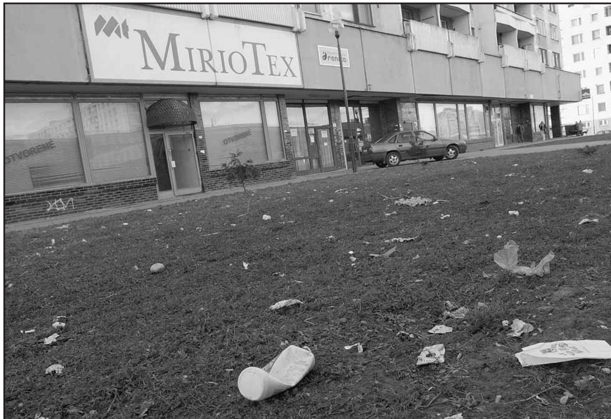
Nielen v Petržalke vydali trávnaté plochy po roztopení snehu takéto svedectvo...