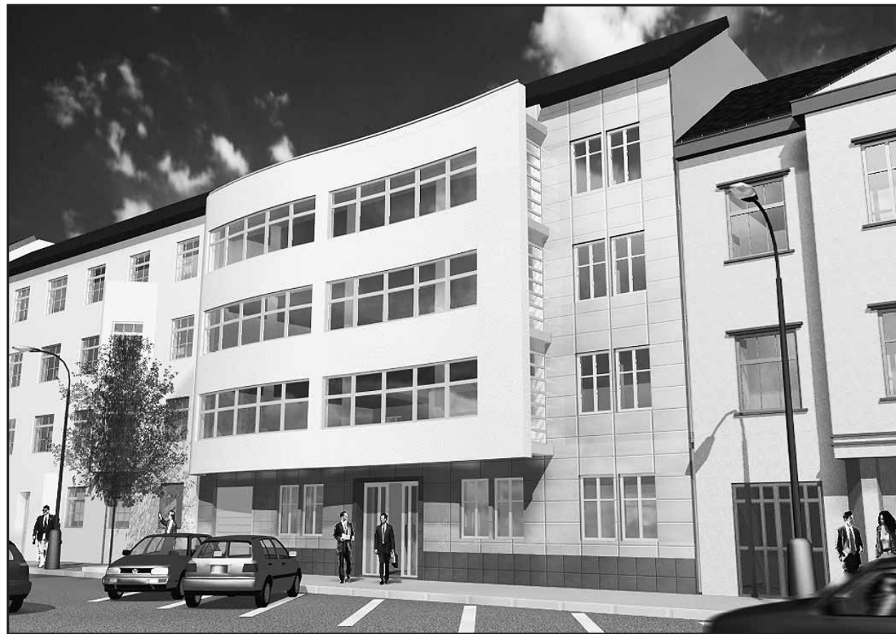
Vedľa budovy mestského požiarneho zboru na Radlinského vyrastá nový polyfunkčný dom. VIZUALIZÁCIA - J&T Global

Pri projektovaní objektu sa dôraz kládol aj na fasádu objektu, ktorá je originálna a atraktívna. Keďže fasády susedných objektov sú plasticky modelované, výsledkom riešenia je plastická predsadená časť fasády v kombinácii s obnovenou časťou pôvodného priečelia. (mer)