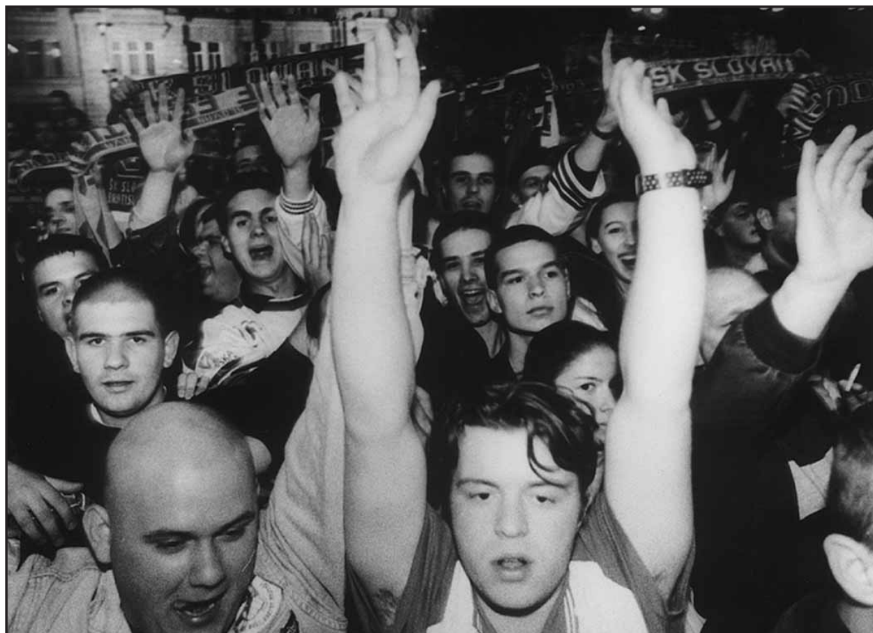
Radosť fanúšikov Slovana na Námestí SNP nemala konca kraja. Viac na 13. strane.

Ako uviedla prezidentka Ligy proti rakovine Eva Siracká, kvietok narcisu predstavuje nádej a symbol života. Má pripomínať, že je veľa ľudí postihnutých rakovinou a že im treba pomôcť. Na Slovensku podľa jej slov na rakovinu ochoreje ročne 20 000 osôb a 11 000 umrie. (brn)