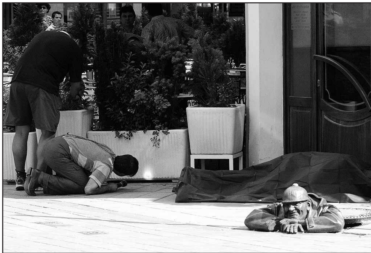
Na korze bol zastrelený muž. Šťastie pre tých, ktorí tam vtedy neboli...