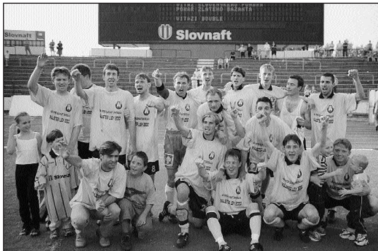
TATRA REAL 166 x 80 mm