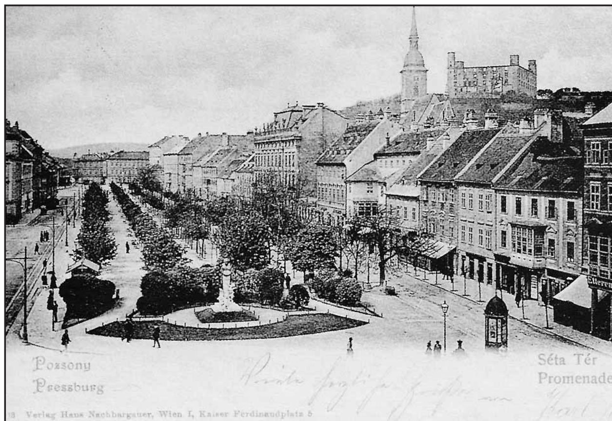
Takto vyzeralo Hviezdoslavovo námestie s promenádou na začiatku 20. storočia.

Mnohé zo stromov sú už dnes prestaruté a námestie skôr špatia ako krásia. Je načase všetky buď orezať do výšky, ako to pred niekoľkými rokmi pokusne urobili pri kaviarni Korzo, alebo všetky odstrániť a nahradiť novými. Tak sa to robí na celom svete. Napokon, udržiavať nízko sa dajú aj platany. Dôkazom je Platanový háj v nemeckom Darmstade udržiavaný v rovnakej výškovej úrovni už 90 rokov. Bratislava a jej obyvatelia by si azda zaslúžili znovuoobnovenie promenády na Hviezdoslavovom námestí, ktorá už pred mnohými rokmi bola obľúbeným miestom prechádzok Bratislavčanov a určite by sa ním stala aj dnes. (šh)