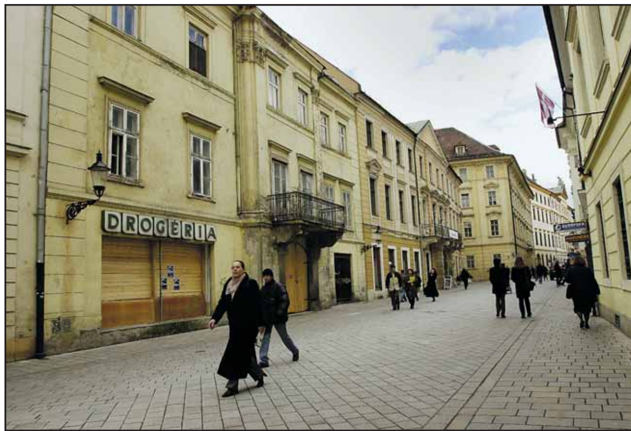
Bratislavčania tento dom na korze dobre poznajú, netušia však, že mu hrozí asanácia.

V treťom bratislavskom okrese sú tak už tri obvodné policajné oddelenia - okrem oddelenia na Jahodovej sú to Obvodné oddelenie PZ Nové Mesto - východ na Šuňavcovej ulici a Obvodné oddelenie PZ Rača na Hubeného ulici. (brn)