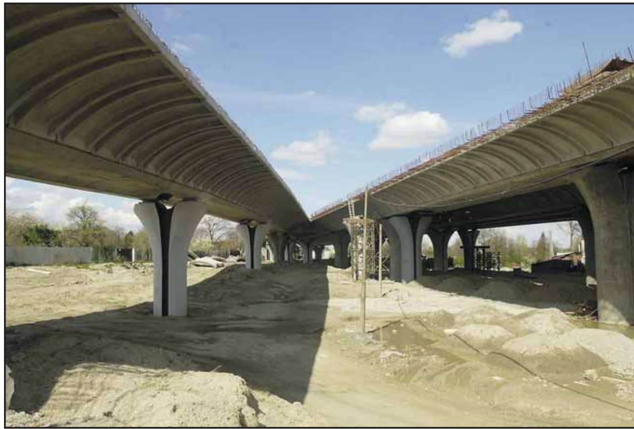
Prvé autá prejdú po novej bratislavskej diaľnici koncom budúceho roka.

Nové parkovacie miesta na Komenského námestí sú vlastne státi premiestnené z konca Gorkého ulice, ktoré tu budú len počas stavebných prác začatých v tejto časti ulice pred niekoľkými dňami. V tejto súvislosti bol zjednosmerný prejazd z Gorkého na Jesenského ulicu. Upozorňujeme preto všetkých vodičov mieriacich do tejto časti centra, že z Jesenského ulice sa na Komenského námestie z tohto dôvodu nesmie odbočiť. Počas stavebných prác na rekonštrukcii Hviezdoslavovho námestia bude ťažšie zaparkovať v okolí pešej zóny. Vodičom, ktorí budú chcieť parkovať v centre mesta, je k dispozícii asi tisíc parkovacích miest v garážach hotela Carlton na Hviezdoslavovom námestí, Alexia na Jesenského a garáži na Uršulínskej ulici. Trend rušenia vyhradených státí na uliciach bude podľa J. Morávka pokračovať, o čom svedčí aj definitívne zrušenie spomínaných 150 miest na Hviezdoslavovom námestí. (brn)