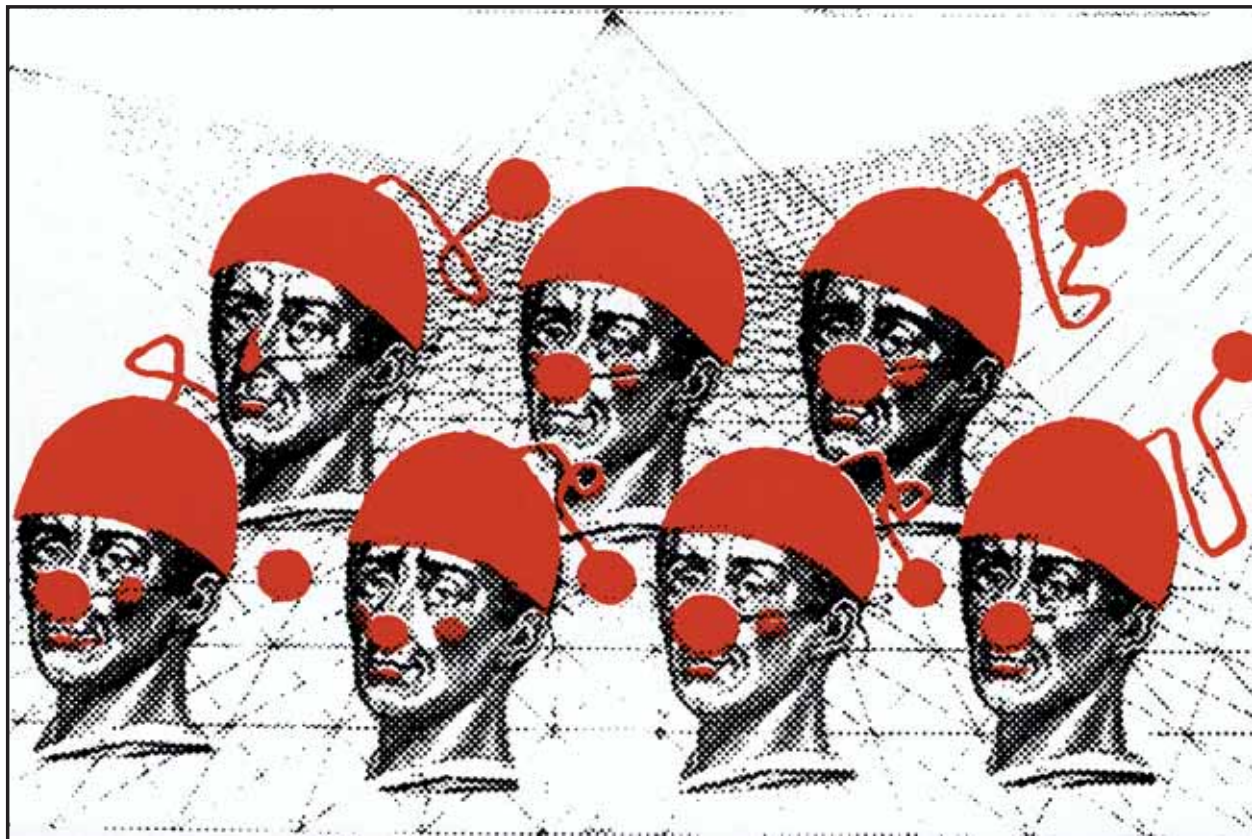
Z výstavy Záhady našej pamäti.