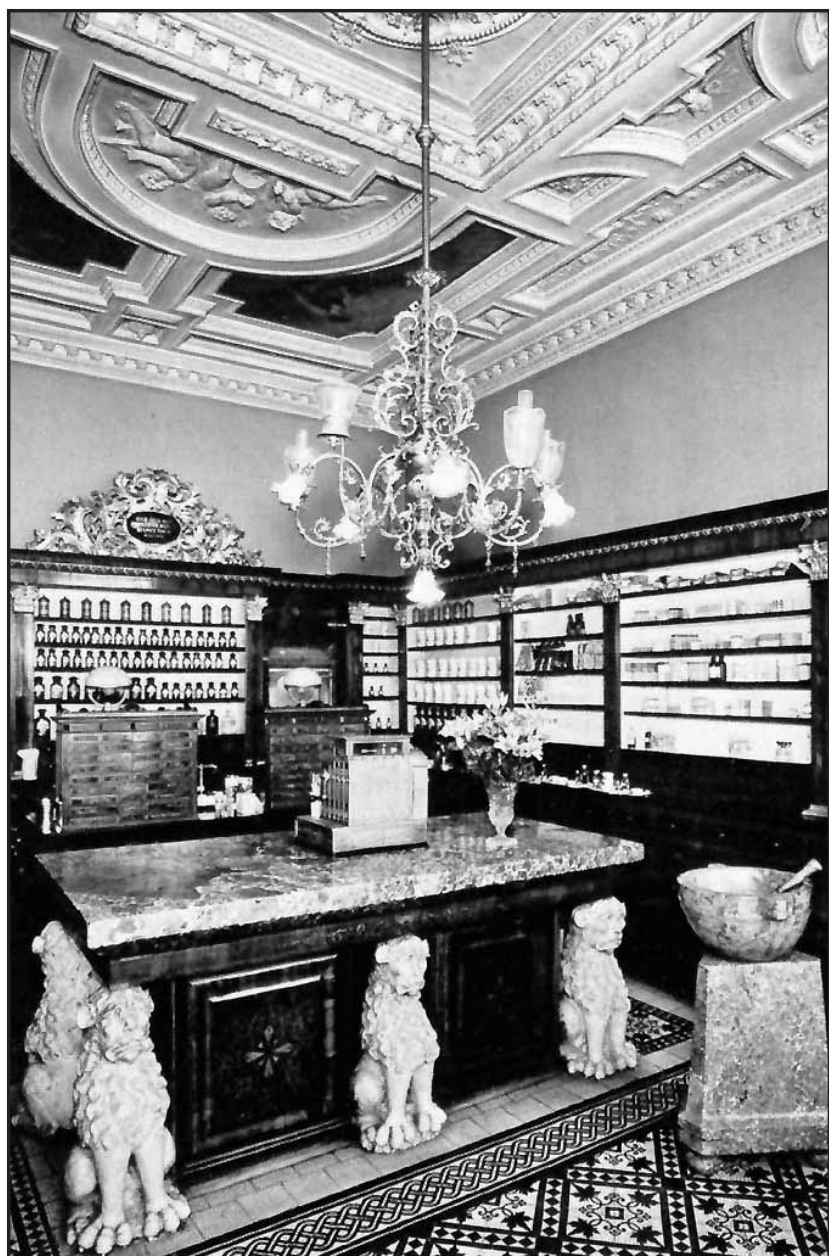
Pôvodný mobiliár v pôvodnej Lekárni u Salvátora...

Historické údaje boli čerpané z článku Fridricha Perényiho: „Bývalá jezuitská lekáreň Salvátor v Bratislave“, ročenka Bratislava 5/1969