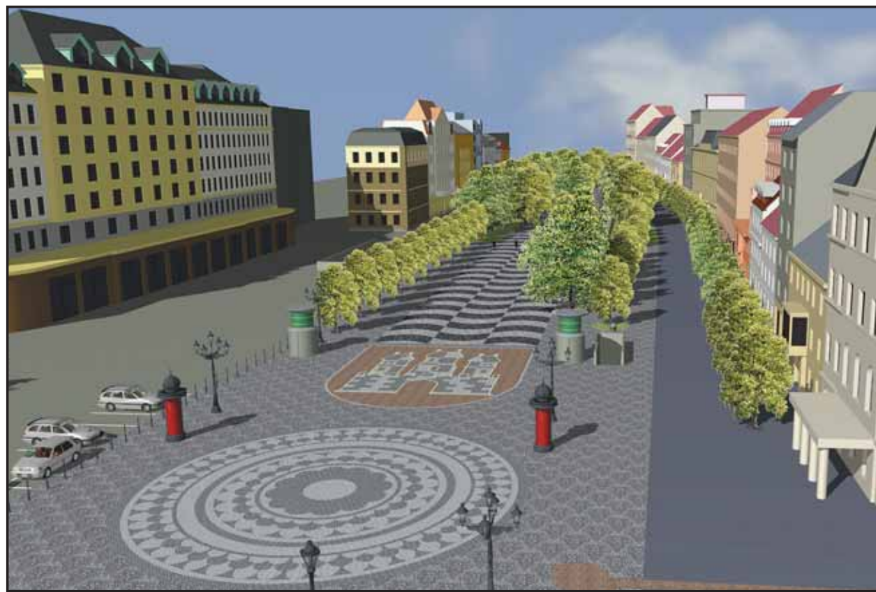
Takto bude vyzerat' Hviezdoslavovo námestie po skončení rekonštrukcie na jar 2002. VIZUALIZÁCIA - R. Hečko/B. Drgoň

Napriek tomu, že štúdia bola spracovaná v dvoch variantoch, poslanci i väčšina verejnosti sa prikláňa k variantu B, ktorý spracovateľ - ateliér APROX - dopracuje do čistopisu. Námestie bude pre individuálnu automobilovú dopravu neprejazdné. Spolu sa na verejnom prerokovaní štúdie, ktoré prebiehalo od 1. apríla do 15. mája 2001, zúčastnilo 82 subjektov, z toho 38 fyzických osôb a 44 organizácií. Treba však spresniť, že mnohí občania poskytli svoje pripomienky v rámci občianskych združení, napr. súborné stanovisko k štúdiu vypracovalo v mene viacerých bratislavských občianskych a ochranárskych organizácií Voľné združenie. Dôležité je, že všetky požiadavky mestskej časti Staré Mesto ako schvaľujúceho orgánu budú súčasťou zadania architektonickej súťaže, ktorá bude v priebehu budúceho roku riešiť konkrétny vzťah námestia. (miv)