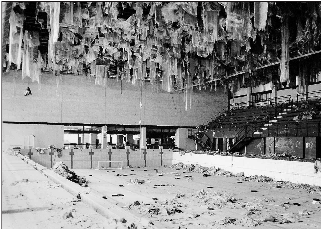
Takýto je pohľad do vnútorných priestorov Kúpeľov Centrál, ktoré sú už viacero rokov devastované. Po rekonštrukcii celého objektu by tu mala vzniknúť moderná nákupná galéria.

„Hotel by mal mať asi 140 izieb a dvomi tunelmi by mal byť prepojený s nákupnou časťou. V objekte bývalých kúpeľov by sa mal nachádzať supermarket a viaceré menšie prevádzky obchodu a služieb. Súčasťou komplexu by mala byť relaxačná zóna poskytujúca možnosti pre športové a relaxačné aktivity.“ Investor si veľa sľubuje predovšetkým od polohy budúcej nákupnej galérie a netají sa zámerom prilákať sem aj renomované firmy, ktoré na Slovensku ešte nie sú etablované. Nezabúda ani na taký dôležitý prvok, akým sú možnosti parkovania. Pod budúcim hotelom by mali byť v podzemí tri podlažia parkovacích plôch, pred objektom ďalšie dve parkovacie podlažia (jedno nadzemné a jedno podzemné). V súčasnosti sa pripravujú podklady na územné konanie. Projektová príprava by mala trvať asi do konca tohto roka a hneď po získaní stavebného povolenia sa investor pustí do práce. Výstavba by mala trvať asi poldruha roka. Skrátka, zakliaty objekt bývalých kúpeľov už v dohľadnom čase zrejme čaká skvelá a zmysluplná budúcnosť. (lau)