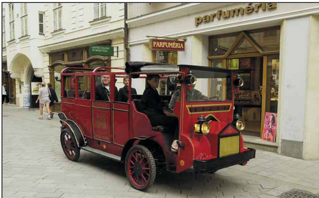
Od augusta môžete na korze stretnúť toto červené vozidlo, ktoré turistom ponúka polhodinovú prehliadku po historickom jadre. Zatiaľ jazdí len skúšobne, od mája by malo premávať každý deň.

S novými cestovnými poriadkami sa môžu cestujúci oboznámiť na internetovej stránke www.dpb.sk. (brn)