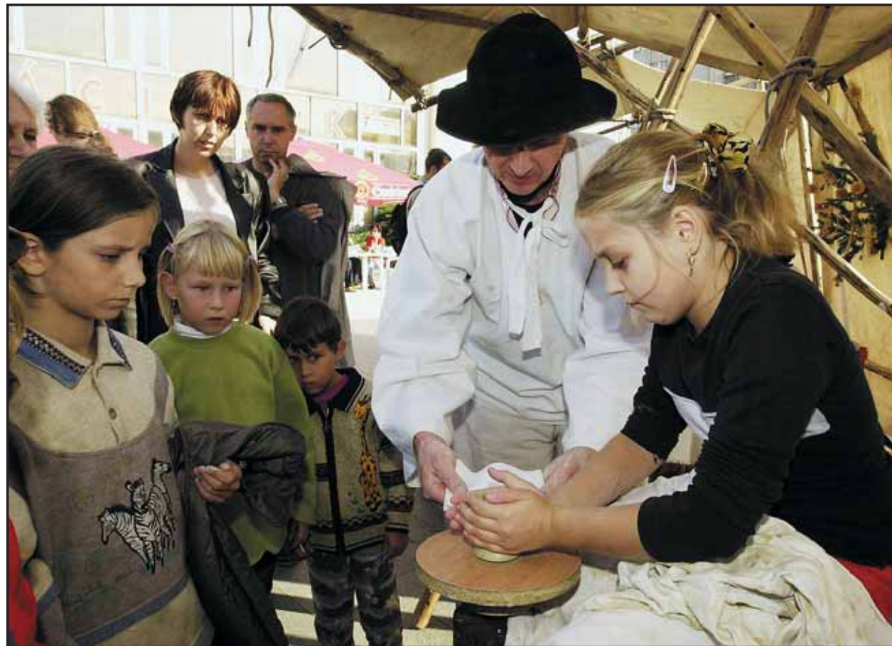
Posledný septembrový víkend prišlo počasie všetkým návštevníkom tradičných hodov - v Dúbravke, Karlovej Vsi a Ružinove. V Dúbravke deti i dospelých najviac zaujalo predvádzanie umeleckých remesiel.

Poslancov a predsedu samosprávy bratislavského VÚC nebudú voliť len Bratislavčania. Do regiónu totiž patria aj okresy Malacky, Pezinok a Senec. Aj preto sú volebné preferencie politických strán v regióne iné ako v Bratislave. Podľa posledného prieskumu by tu zvíťazila koalícia HZDS-SNS (33 %) pred koalíciou SDKÚ-SMER (24 %) a koalíciou ANO, KDĽ, SMK, DS (19 %). (brn)