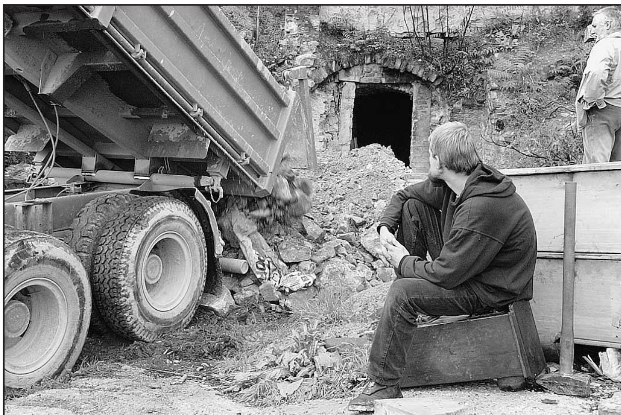
Mesto vykávalo bezdomovcov z priestorov skalného brala pod Hradom. K podobným opatreniam došlo aj v minulosti, vždy však bezúspešne. Aby sa situácia neopakovala, mesto nariadilo „jaskyne“ natrvalo zamurovať.

Akékoľvek informácie týkajúce sa tohto prípadu oznámte na tel. č. 09610 31310 alebo na linku 158.