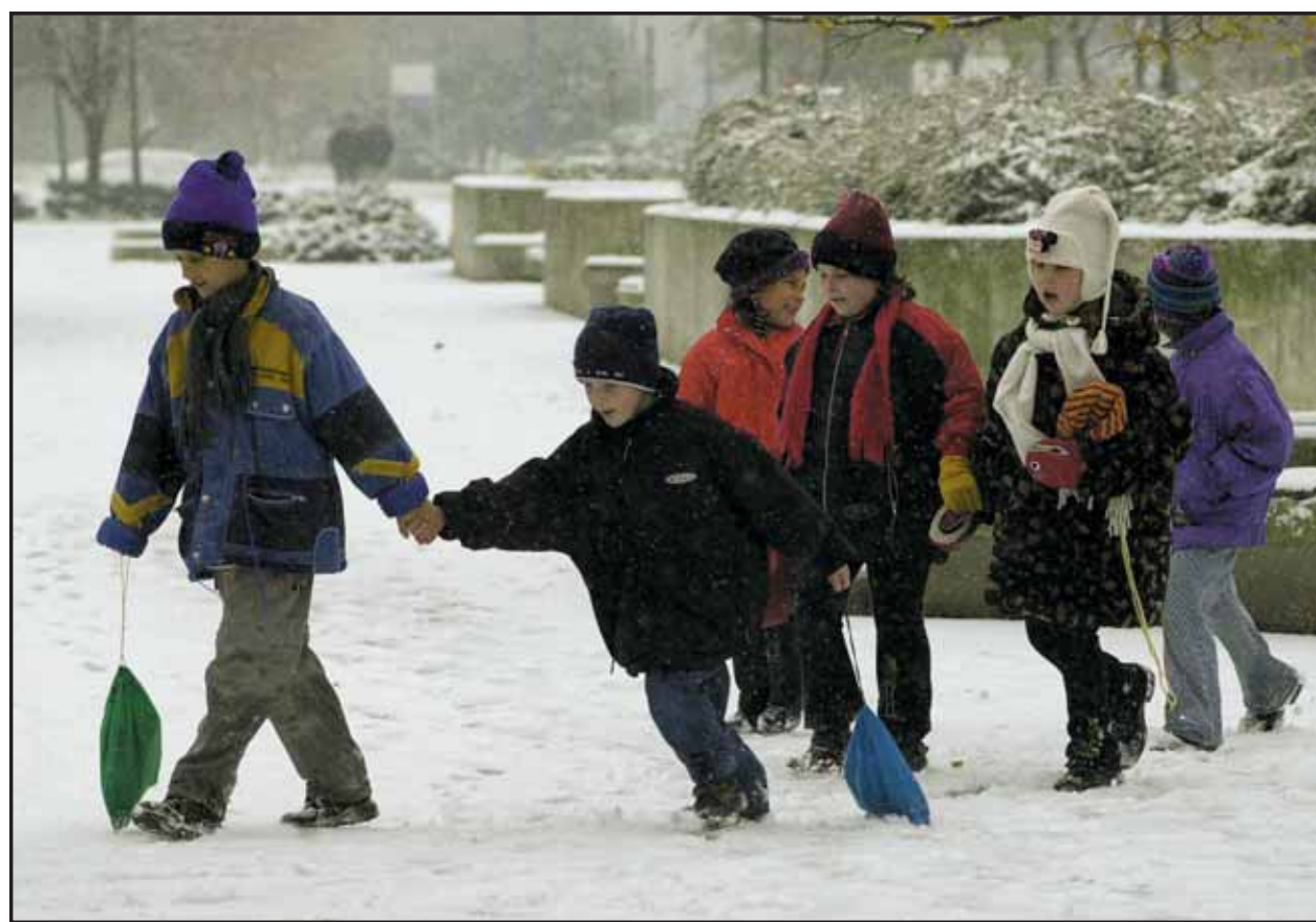
Prvý tohtoročný sneh už napadol v utorok 27. novembra aj v Bratislave.

Pečenie vola organizuje od roku 1998 Združenie Devínska brána ako pripomienku korunovačných slávností v Bratislave. Organizátori tradičného opekania tak pokračujú v dobových zvyklostiach, ktoré sa radujú do 16. storočia. Veď prvého vola v Bratislave upiekli už v roku 1543 pri korunovácii kráľa Maximiliána. Meno tohtoročného vola ešte nie je známe. (brn)