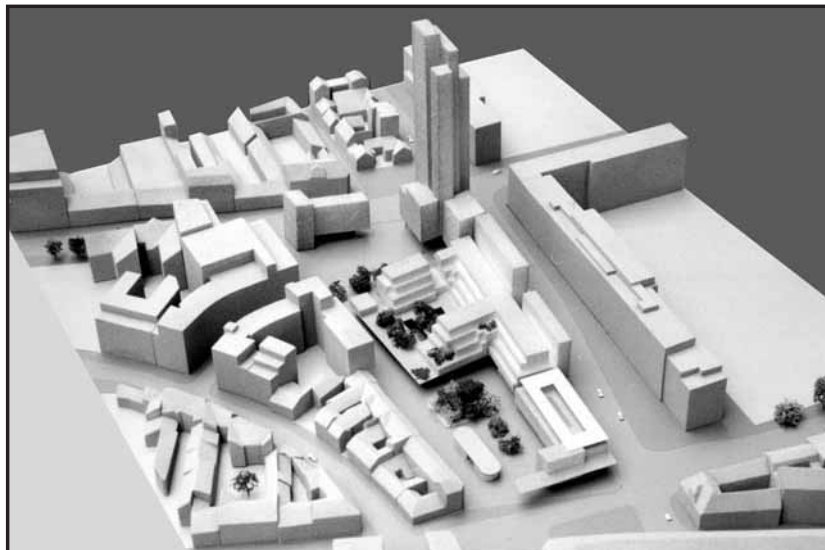
Variant C ráta so zastavaním hornej časti námestia.