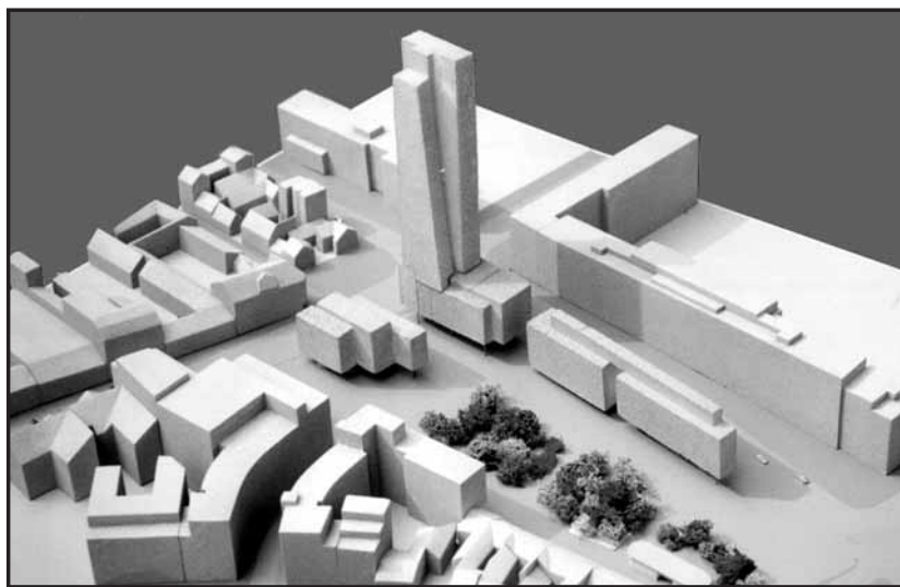
Variant A ráta s intenzívnou výškovou zástavbou.