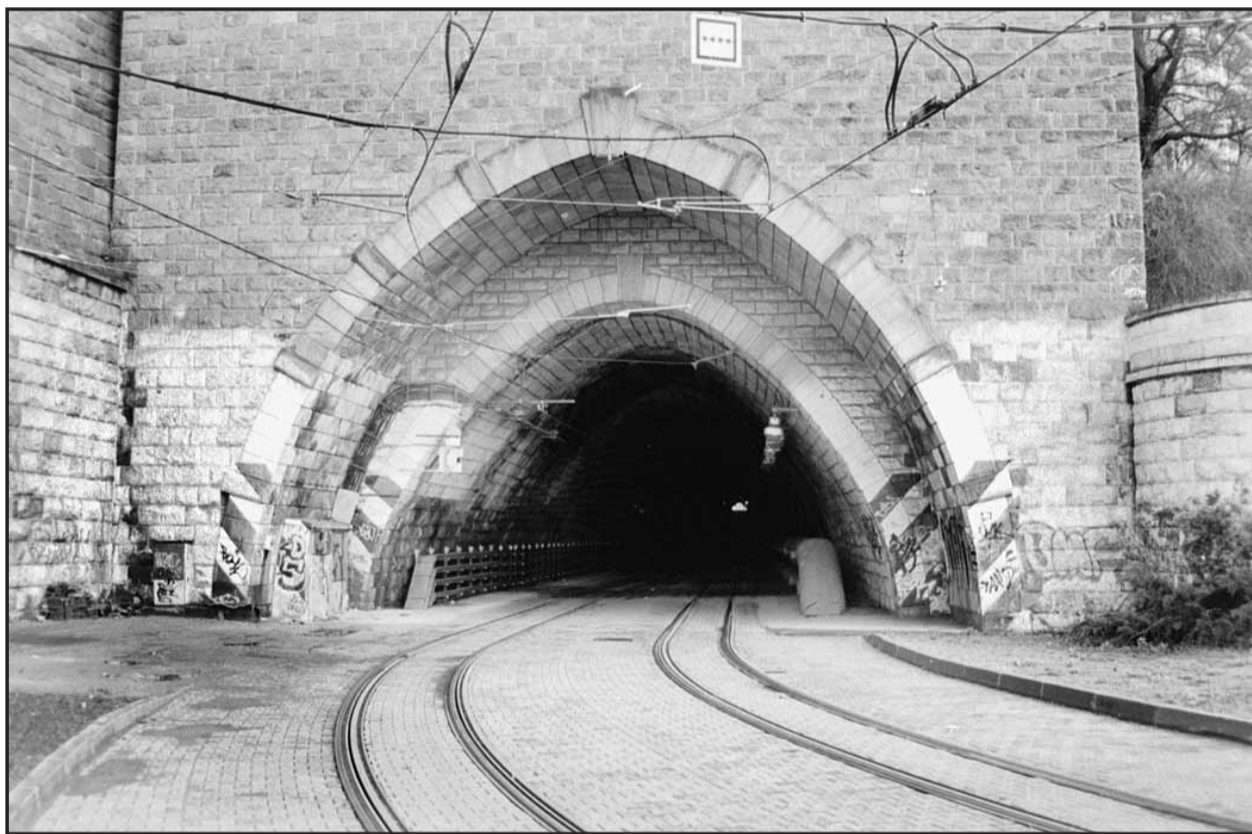
K zodpovednosti za stav tunela pod Hradným vrchom sa nikto nehlási.