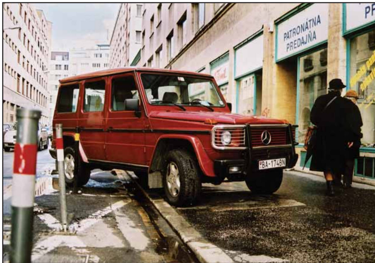
Nedovoleným spôsobom parkuje v meste denne asi 4-tisíc áut. Podľa novely zákona o premávke na pozemných komunikáciách ich nie je jednoduché odťahnúť, a tak naďalej parkujú napríklad na chodníkoch...