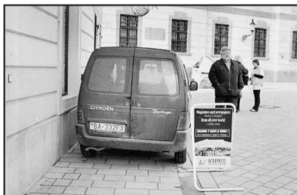
Sedlárska ulica 22. 3. 2002 Čas: 12 25