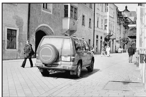
Ventúrska ulica 22. 3. 2002 Čas: 12 13

Napriek tomu, že v pešej zóne platí nariadenie o zákaze parkovania na ulici, situáciu na bratislavskom korze charakterizujú nasledujúce fotografie. (lau)