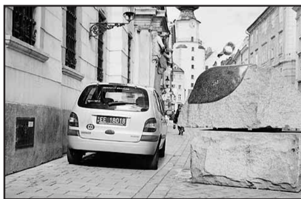
Michalská ulica 22. 3. 2002 Čas: 12 16