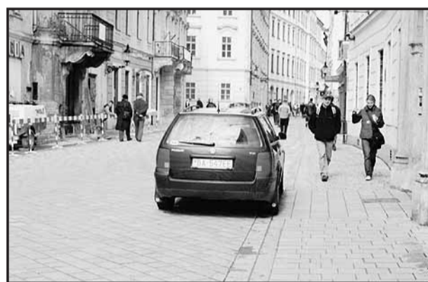
Ventúrska ulica 22. 3. 2002 Čas: 12 14