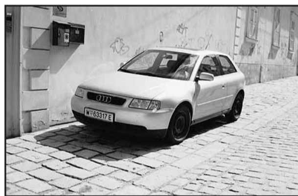
Kapitulska ulica 22. 3. 2002 Čas: 12 30