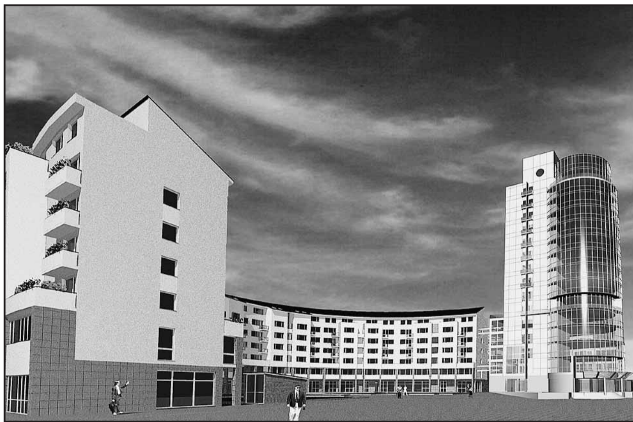
Dominantou námestia bude výšková administratívna budova.