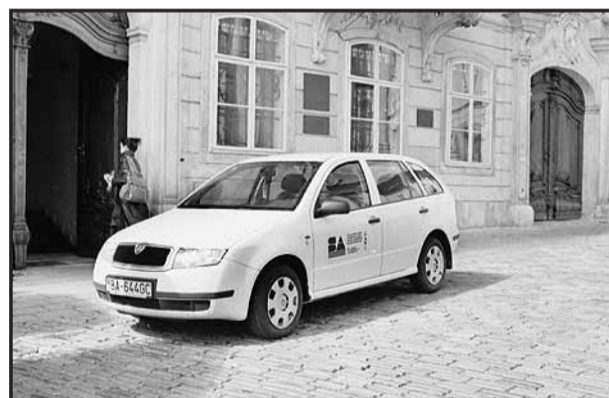
Františkánske nám. 22. 3. 2002 Čas: 12 22