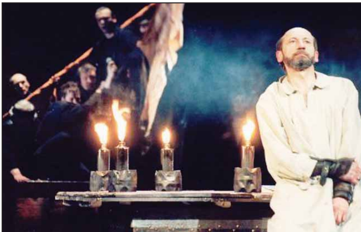
Litovské národné činoherné divadlo príde do Bratislavy s hrou Richard III.

Bratislavské Vloviny najbližšie vyjdú 4. 7.