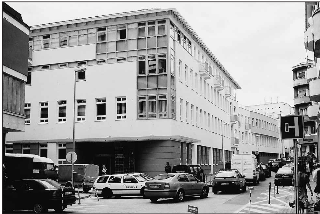
Nové pavilóny Nemocnice Milosrdní bratia stoja na rohu Kolárskej a Treskoňovej ulice.

Kongregáciou sestier sv. Františka z Assisi, ktorá je jeho vlastníčkou. Po uvoľnení a postupnej asanácii budov a dvorov na rohu Kolárskej a Treskoňovej ulice sa v decembri roku 2000 začala rekonštrukcia a dostavba. Po odovzdaní prvej etapy rekonštrukcie a dostavby budú práce pokračovať kompletnou rekonštrukciou a reštaurovaním barokového objektu na Námestí SNP, s predpokladaným termínom dokončenia v máji 2003. Prevádzka bude po rekonštrukcii umiestnená v troch navzájom stavebne a funkčne spojených pavilónoch. Projekt rekonštrukcie počítá s možnosťou plne zaťažiť jednotlivé prevádzky typicky pre malú polyfunkčnú nemocnicu s poliklinikou. Stojí za zmienku, že náklady len do ukončenia prvej etapy predstavovali 276 miliónov korún, pričom šlo o súkromné zdroje rehole, bez štátneho príspevku. (juh)