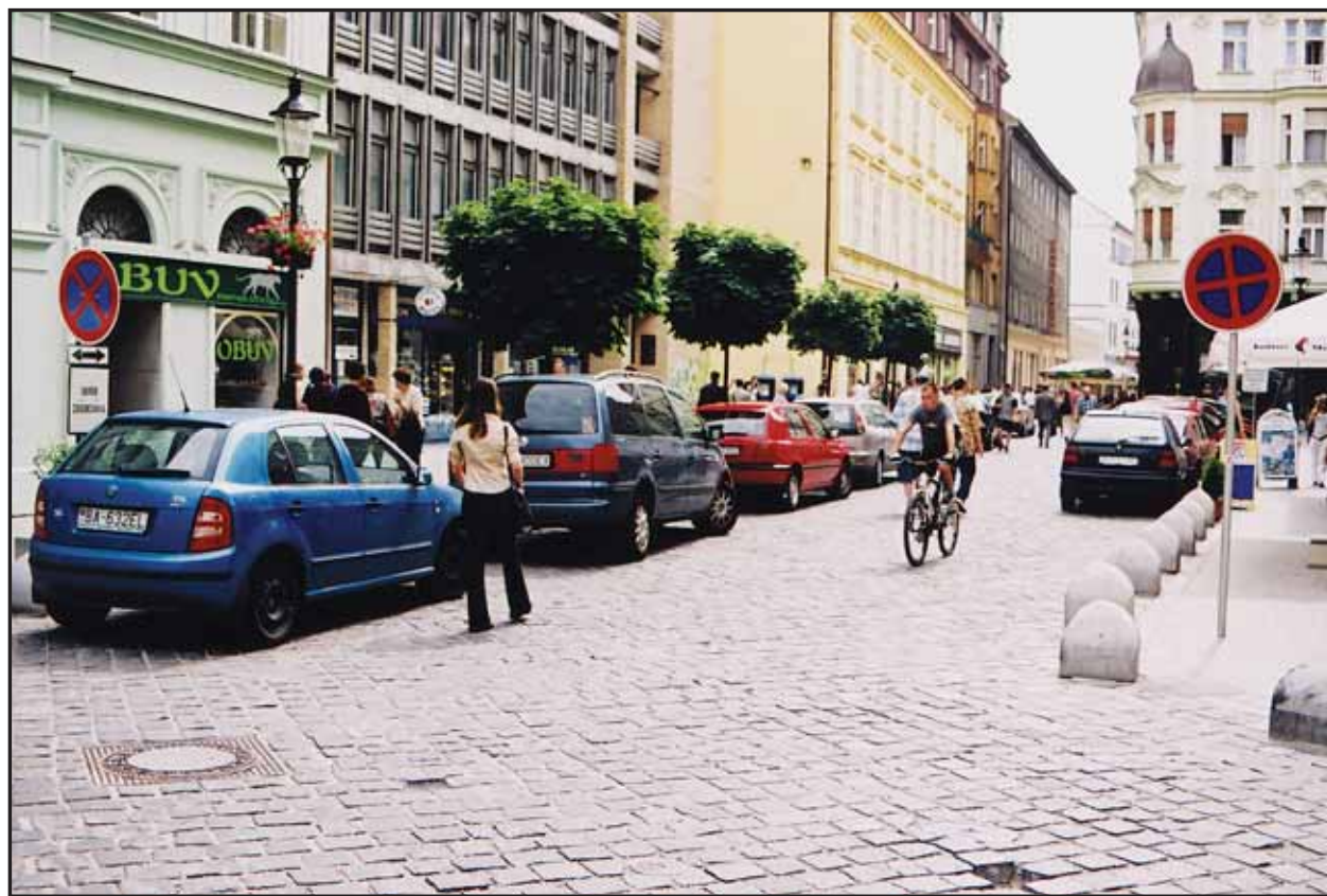
Situáciu na Laurinskej ulici Bratislavčania dôverne poznajú, polícia o tom však nič nevie.

Noviny vychádzajú každý druhý štvrtok, v poštových schránkach by ste ich mali mať do soboty. Ak ich v poštových schránkach nenájdete včas, zavolajte nám, pošlite faxovú alebo elektronickú správu. Redakcia