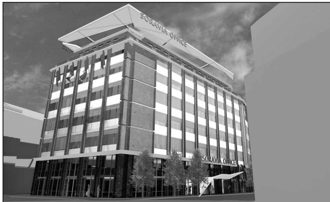
Takto by mala vyzerat' po plánovanej prestavbe budova bývalej Pravdy na Štúrovej ulici. VIZUALIZÁCIA - Soravia Invest

Začiatok rekonštrukcie je naplánovaný na február 2003, jej ukončenie na november budúceho roka. Budova má byť využitá predovšetkým na kancelárske účely a administratívne priestory budú na ploche asi 11-tisíc štvorcových metrov. Na prízemí by mali byť obchodné priestory s plochou okolo tisíc štvorcových metrov. Podľa B. Randu však zmena v plochách nie je vylúčená. Architektonické riešenie budovy zostane zachované, zmenená bude fasáda a vstupné priestory. Súčasťou objektu majú byť podzemné garáže so 123 parkovacími miestami. (lau)