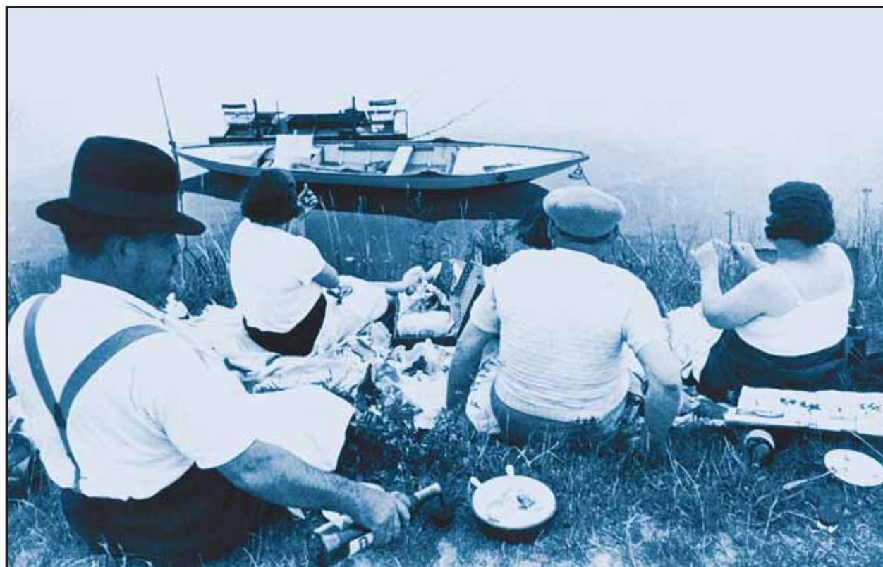
Fotografie svetoznámeho Henri Cartier-Bressona môžete v rámci Mesiaca fotografie vidieť v Pálffyho paláci GMB.

Bratislavské Noviny najbližšie vyjdú 7. 11.