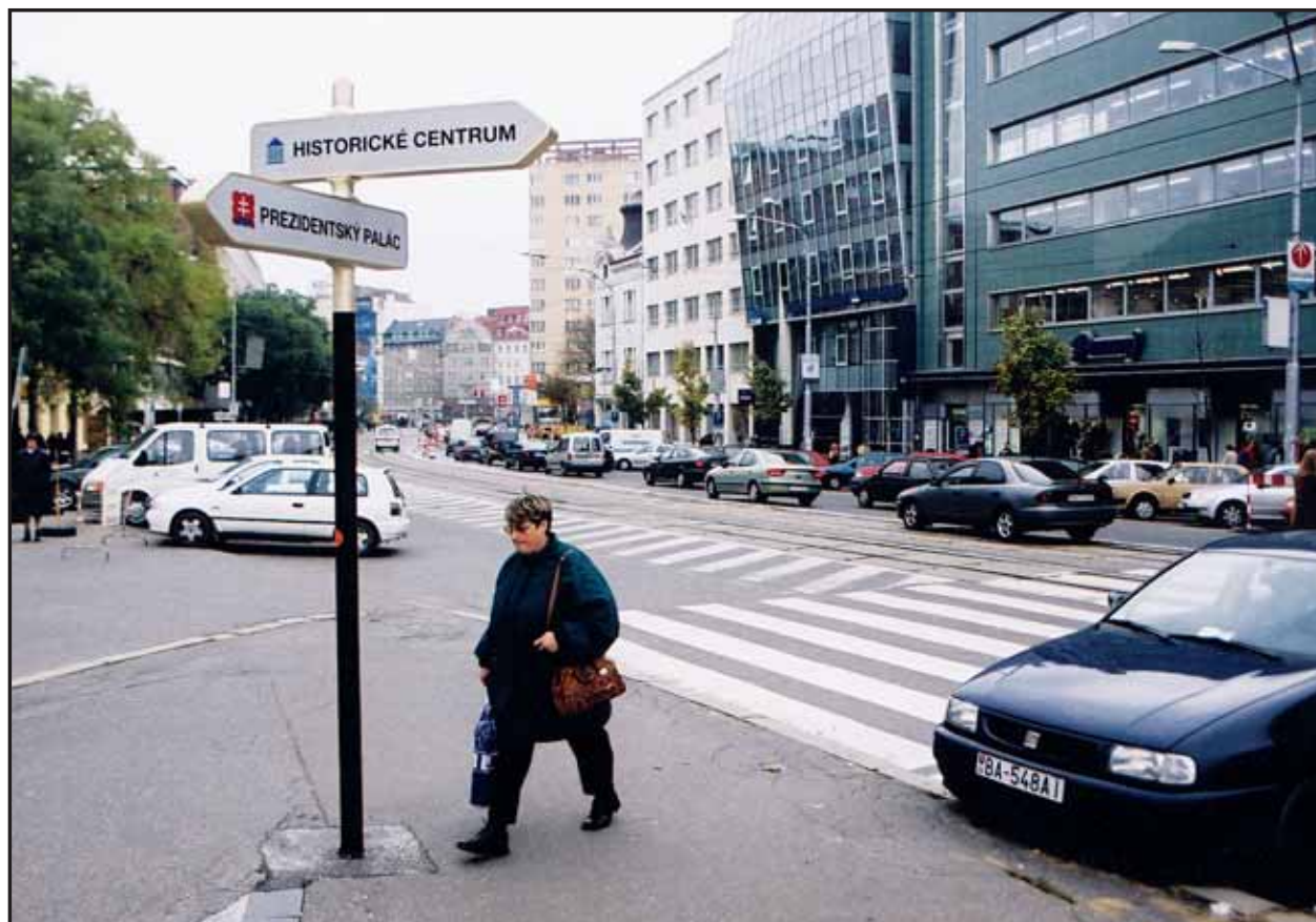
Na nových smerovníkoch v centre sú, žiaľ, iba slovenské nápisy.