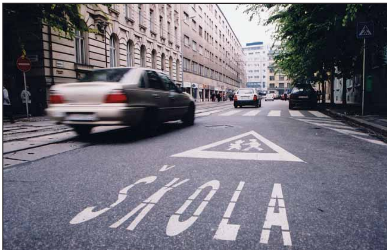
V súvislosti s novými dopravnými opatreniami v centre Bratislavy sa na cestách v blízkosti staromestských škôl objavilo aj takéto dopravné značenie upozorňujúce vodičov na zvýšený pohyb školákov.

dopravným obmedzením a schválením príslušného VZN o podmienkach parkovania v zóne umožňuje realizovať ďalšie opatrenia slúžiace k zlepšeniu života v centre mesta. Za splnený možno považovať aj cieľ podporiť mimouličné parkovanie - v centre mesta pribudlo za posledných 5 rokov asi 1400 garážových státi. Mestská časť Bratislava - Staré Mesto aktivuje využitie vnútroblokov a dvorov na parkovanie pri zachovaní a vytvorení zelene a priestorov pre deti (prieskum zisťoval asi 1400 možných miest na parkovanie). Preferenciou MHD pred automobilovou dopravou sa sleduje zlepšenie podmienok cestujúcich (napríklad len na Hurbanovom námestí za sledované mesiace úspora času cestujúcich predstavuje asi 80 000 hodín, alebo inak povedané, úspora času na jedno vozidlo MHD je 1 minúta). Opatrenia boli prijaté aj na ďalších križovatkách, Rajska - Dunajská a 29. augusta - Mickiewiczova. (ver)