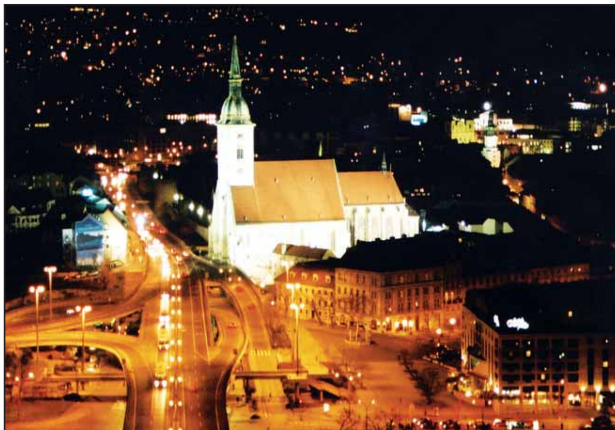
Vysvietený Dóm sa stal výrazným spestrením nočnej panorámy Bratislavy.

Zoznam všetkých kandidátov na poslancov do bratislavského mestského zastupiteľstva nájdete na 14. a 15. strane.