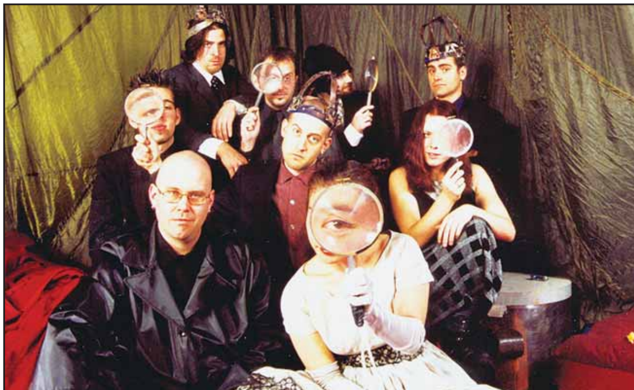
Americký Degenerate Art Ensemble vystúpi 1. 12. v rámci festivalu Next 2002 s nespútanou zmesou klasickej hudby, jazzu, rocku a vizuálnych efektov.

Bratislavské Noviny najbližšie vyjdú 5. 12.