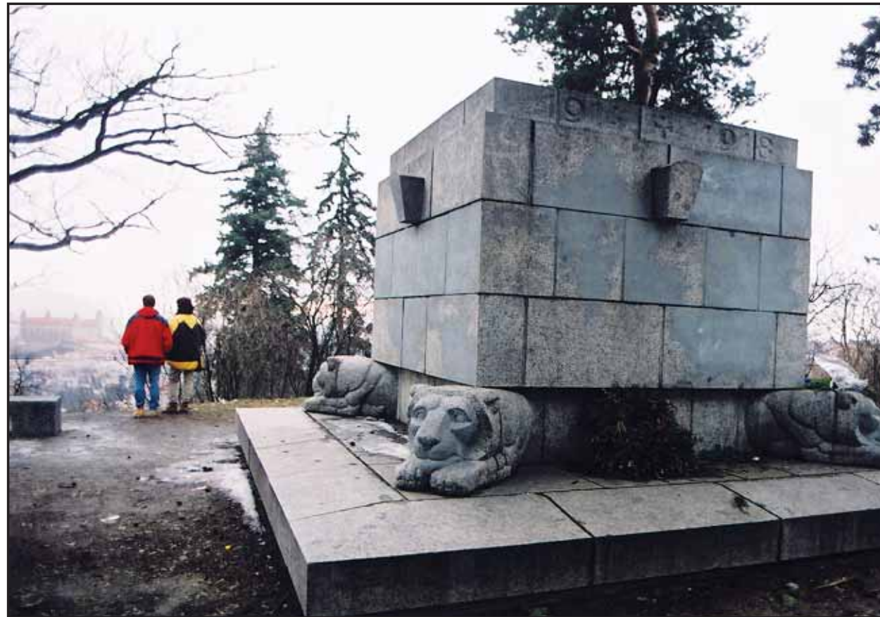
Pamätníku obetiam 1. svetovej vojny na Murmane hrozí odstránenie.