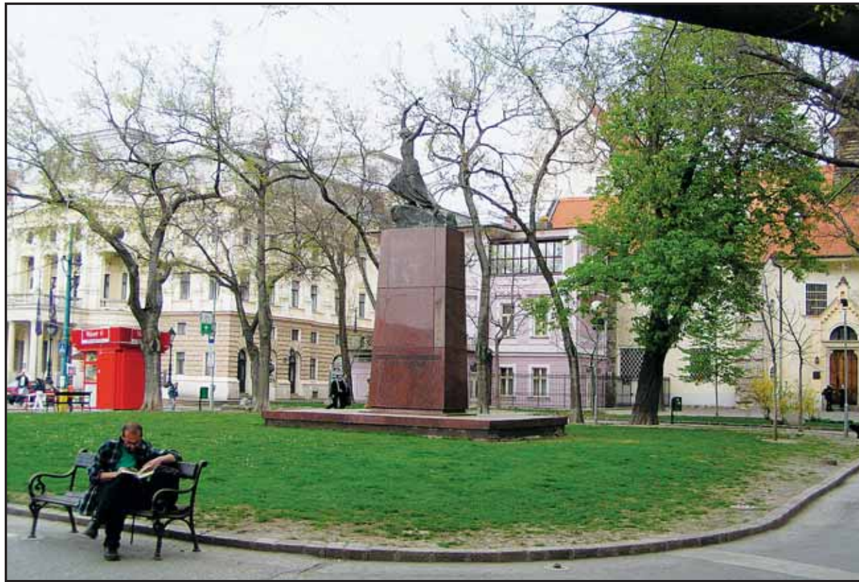
Trávnik v parčíku vedľa Carltonu nahradí po rekonštrukcii kamenná dlažba.

V marci mestská polícia minula na svoju činnosť 5,825 milióna korún, z toho vyše 4,6 milióna bolo určených na mzdy a odvody do sociálnych fondov. Mestská polícia mala v marci 230 zamestnancov a ich priemerná mesačná mzda bola 14 425 korún. (brn)