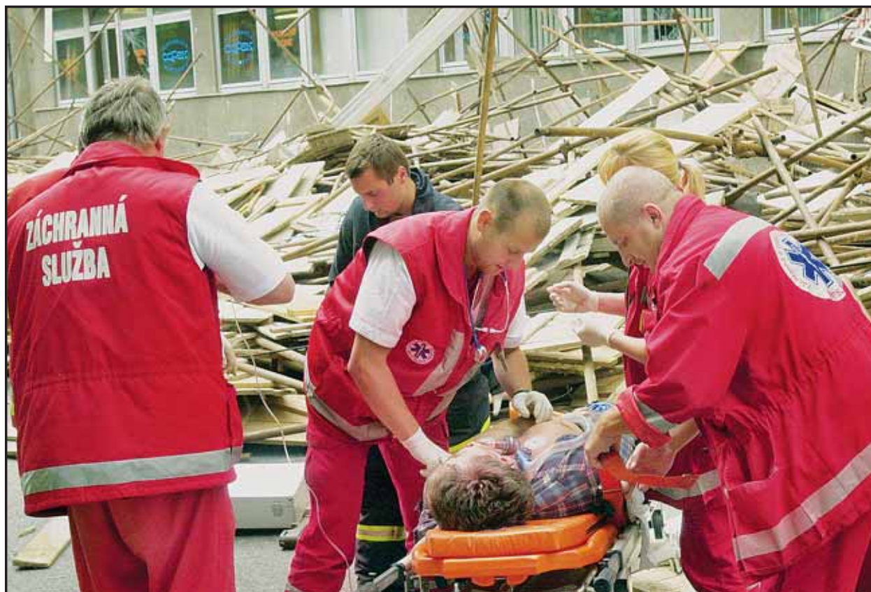
Jeden mŕtvy a štyria zranení - taká je bilancia pádu lešenia na Ulici 29. augusta.

Slovensko by sa spoločne s deviatimi ďalšími kandidátskymi krajinami malo stať plnoprávnym členom Európskej únie 1. mája 2004. (red)