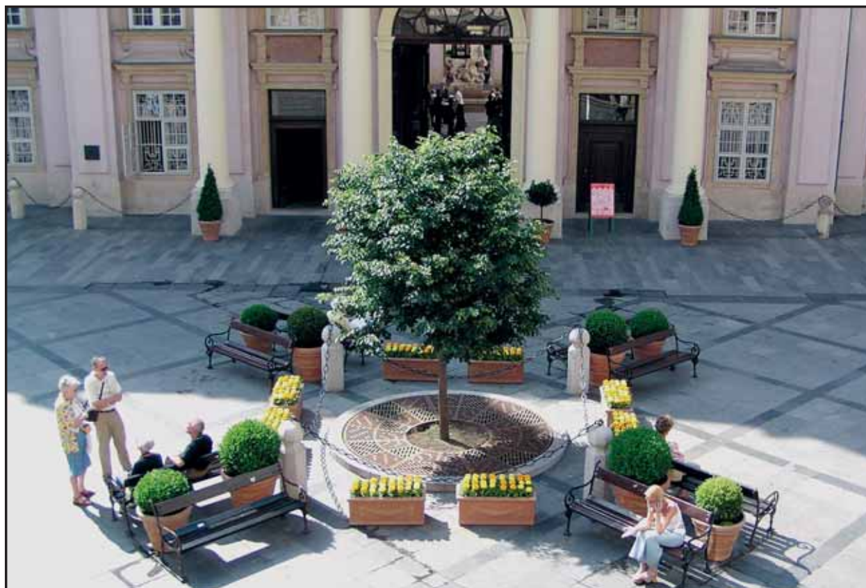
Doneďavna neosobné a neútlmné Primáciálne námestie vďaka novej mobilnej zeleni ožilo. Možnosť posedieť si na skrášľenom námestí ocenia turisti, ale aj bratislavskí dôchodcovia či rodičia s malými deťmi.

Pretože diaľnica D2 bude prechádzať cez súčasný vstup do ZOO, je súčasťou stavby aj nový vchod do ZOO od ulice Staré grunty. (juh)