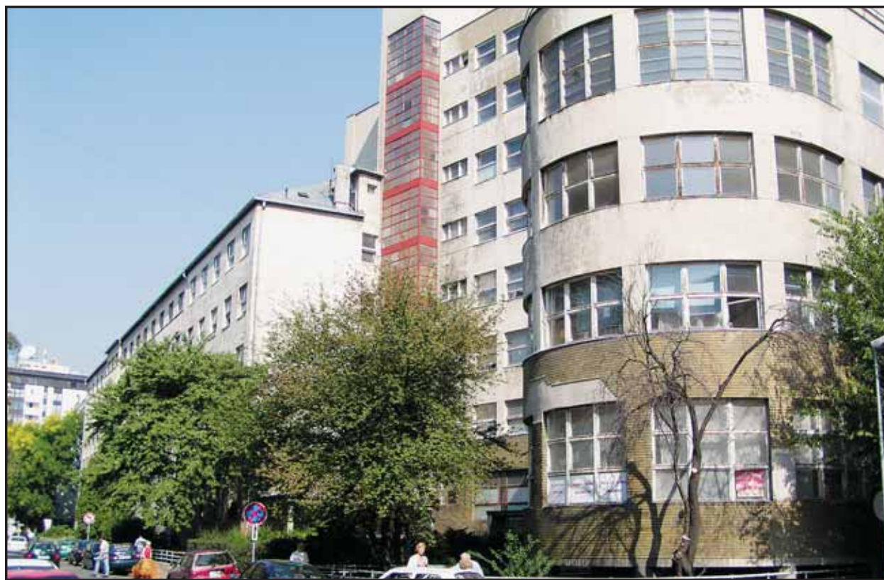
V rámci úsporných opatrení v bratislavských zdravotníckych zariadeniach sa niektoré pracoviská sťahujú. Medzi budovy, ktoré sa majú po vyprázdnení predať, patrí aj objekt Polikliniky na Bezručovej ulici.

Organizačnú štruktúru by mal doplniť nový výkonný útvar, ktorého pracovníci budú vycelení špeciálne na to, aby zasahovali v prípadoch narušení objektov signalizovaných cez pult centralizovanej ochrany. Nový organizačný poriadok vytvára predpoklady na zriadenie metropolitnej polície, ktorá by mala v budúcnosti dohliadať na bezpečnosť obyvateľov mesta. (ver)