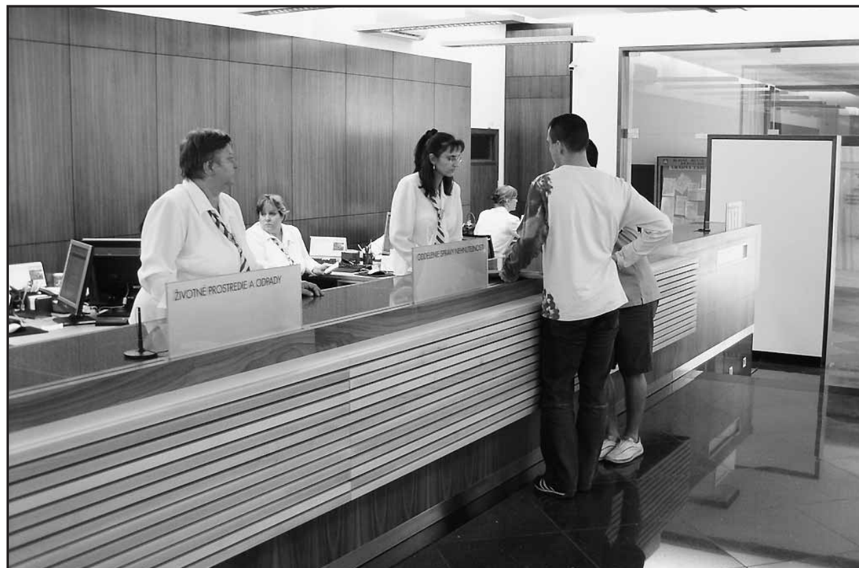
Nové pracovisko magistrátu Služba občanom/Front Office, ktoré otvorili v týchto dňoch v zrekonštruovaných priestoroch na prízemí novej radnice, už funguje naplno.

Nové, moderne vybavené pracovisko sídli v zrekonštruovaných priestoroch na prízemí Novej radnice. Priestory sú bezbariérové a sú riešené tak, že pracovníci magistrátu nemôžu ostať s návštevníkmi osamote, čo má predísť korupcii (k dispozícii sú aj oddelené priestory na diskretné rokovania, sú však presklené). Rekonštrukcia trvala od 5. júla do 10. septembra a vyžiadala si náklady takmer desať miliónov korún, ktoré podľa slov A. Ďurkovského magistrát získal šetrením na iných činnostiach. Služby budú občanom poskytovať v pondelok od 8. do 17. hodiny, v utorok, stredu a vo štvrtok od 8. do 16. hodiny a v piatok od 8. do 15. hodiny. (juh)