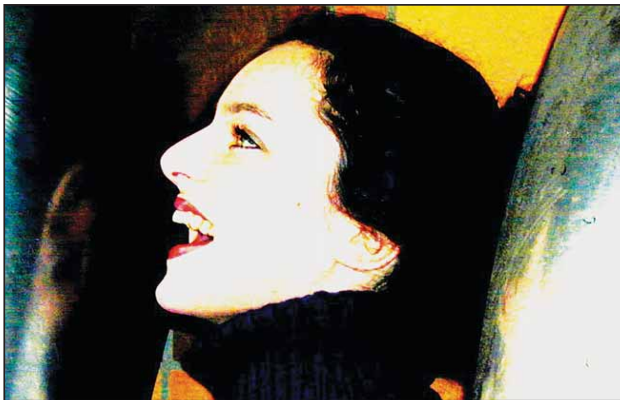
Koncert nórkej hudobníčky Maje Ratkje bude jedným z vrcholov festivalu NEXT 2003

Bratislavské Noviny najbližšie vyjdú 4. 12.