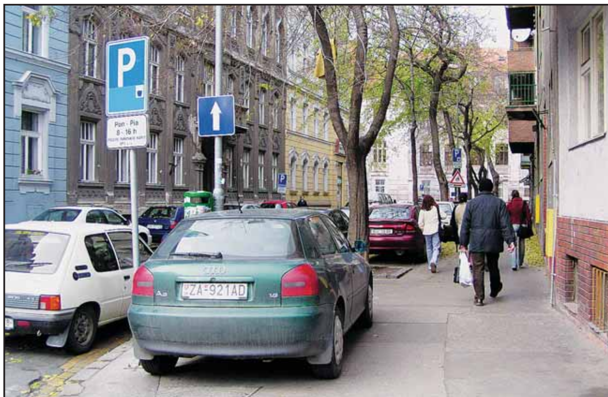
Policajti si zatiaľ takéto správanie vodičov veľmi nevšímajú, čoskoro by sa to však malo zmeniť.

Vzhľadom na túto situáciu sa starostovia rozhodli, že pošlú vláde Apelačný list, v ktorom upozornia na alarmujúci stav základného školstva, ktorý vznikol po prechode školstva zo štátnej správy na samosprávu. V koncepcii verejnej správy bola zakotvená povinnosť štátu preniesť kompetencie spolu s financiami. Starostovia konštatovali, že decentralizačná dotácia bola poskytnutá len čiastočne. Zástupcovia mestských častí zodpovedne posúdili stav do konca roku 2003, ktorý potvrdil, že prevádzka základných škôl a školských zariadení v Bratislave je nedofinancovaná. Vedenie mesta a mestské časti dôrazne upozornili, že štát musí tieto chýbajúce finančné prostriedky vykryť v zmysle koncepcie reformy a modernizácie verejnej správy a ďalších príslušných predpisov. (lau)