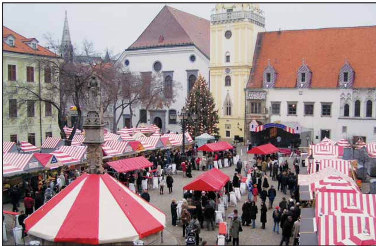
Na tohtoročných Vianočných trhoch sa predáva v 90 nových stánkoch.