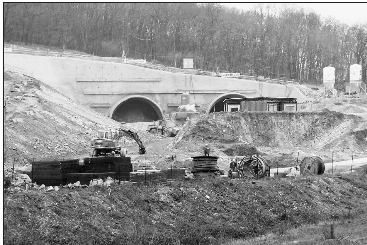
Vstupné portály do tunela popod masív Sitiny sú už zreteľne viditeľné, tempo prác na razení tunela i na výstavbe celého diaľničného úseku Lamačská cesta - Staré grunty sa zvyšuje.

Do konca tohto roka by mali byť ukončené práce na novom vstupe do ZOO, vrátane parkovísk pre jej návštevníkov. Celá výstavba bude trvať ešte tri roky, doprava cez nový diaľničný úsek by mala byť spustená v decembri 2006 a stavbu odovzdajú na jar 2007. (juh)