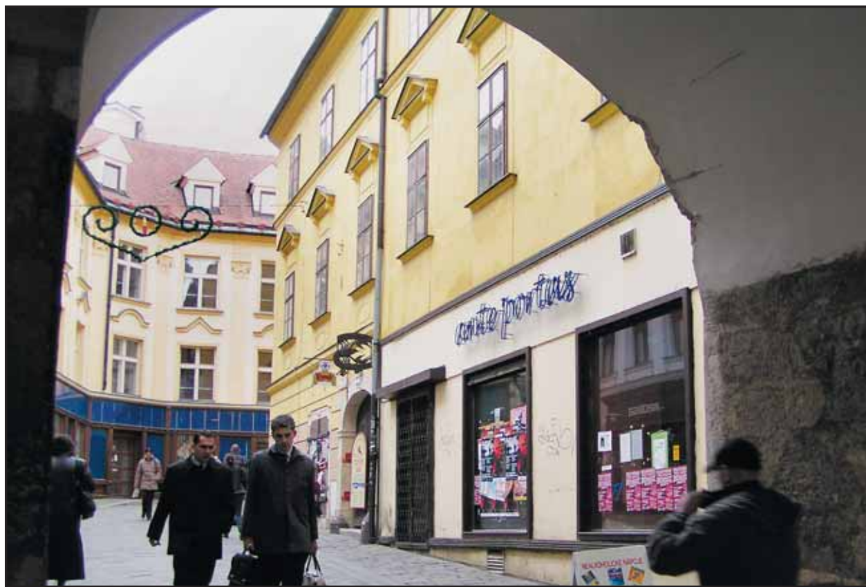
Nový vlastník bude musieť historické domy pri Michalskej bráne zrekonštruovať.