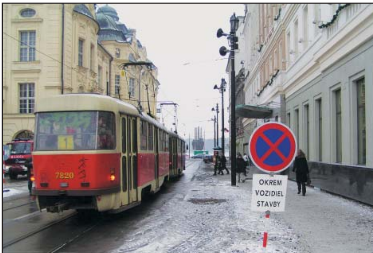
Po rekonštrukcii trate električiek na Mostovej ulici zostáva opraviť ešte chodníky.

Ak sa podarí naplniť Plán priorít Bratislavy na roky 2004-2006, ktorého súčasťou je aj výstavba obecných bytov, viaceré z nich by mohli mať nových obyvateľov spomedzi mladých vedeckých pracovníkov. Netreba sa preto báť o vymretie Bratislavy, počet obyvateľov zostane zrejme okolo 420- až 430-tisíc aj v budúcnosti. (red)