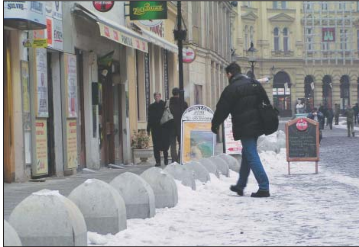
Z časti Laurinskej ulice je pešia zóna, kamenné zábrany sú už teda zbytočné.

Presný počet „biskupských klobúkov“ rozmiestnených v centre mesta nie je známy. Dôvodom je podľa V. Glasu to, že kamenné zábrany v tvare biskupského klobúka nerozmiestňuje len mestská časť, ale aj magistrát, pretože niektoré komunikácie spravuje mesto, a sú aj zábrany, ktoré osadili iné subjekty. Osadzovanie „biskupských klobúkov“ na uliciach v centre mesta treba podľa jeho vyjadrenia zvažovať citlivo, pretože sú pomerne široké a v niektorých prípadoch by mohli zužovať priestor pre chodcov. (ver)