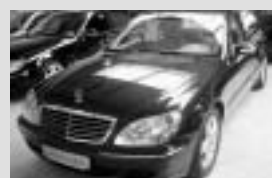
Mercedes-Benz S 320 CDI r. v. 2002, 13 500 km, almandischwarz metaliza, šedá koža, park. systém, roletky na oknách, predné vyhr. sedadlá s vetraním, bixen. svetlomety, CD menič, servozatvárah, úverí, el. vyhrievaných sedadiel cena 2 790 000,- Sk