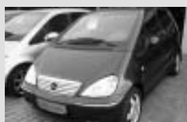
Mercedes-Benz A 190 Lang r. v. 2002, 29 700 km, atollblau metaliza, interiér koža/látka, autom. prevodovka, klimatizácia, 10 RDS s CD, opierka rúk vpredu, bočné airbagy vpredu, centrá, el. spätné zrkadlá, výbava Avantgarde cena 720 000,- Sk