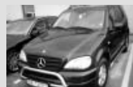
Mercedes-Benz ML 320 r. v. 2001, 77 660 km, čierna metaliza, šedá koža, alarm, sound systém, CD menič, bočné airbagy vpredu, predné sedadlá ovlád. elektr. a s vyhrievaním, elektr. posuvno-výklopná strecha, tážne zariadenie cena 1 490 000,- Sk