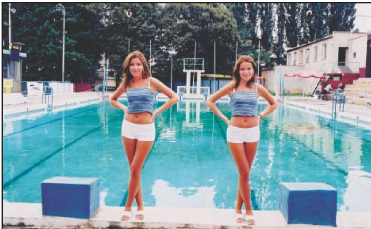
Súčasní návštevníci aj pamätníci dejín košickej plavárne sú hrdinami celovečerného filmu 66 sezón dokumentaristu Petra Kerekesa, ktorý už získal hlavnú cenu na festivale v Jihlave.

Bratislavské Noviny najbližšie vyjdú 12. 2.