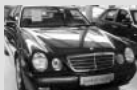
Mercedes-Benz E 200 Kompressor r. v. 2001, 52 000 km, čierna smaragd metaliza, manuálna 6-stupňová prevodovka, autom. klimatizácia, vak na lyže, dažďový senzor, vpredu bočné airbagy, rádio MB Audio 10 RDS s CD prehrávačom cena 880 000,- Sk