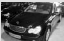
Mercedes-Benz C 220 CDI r. v. 2000, 122 750 km, čierna obsidian metaliza, manuálna 6-stupňová prevodovka, klimatizácia, rádio MB Audio 10 RDS s CD prehrávačom, tempomat, palubný počítač, roletky na oknách, výbava Classic cena 850 000,- Sk