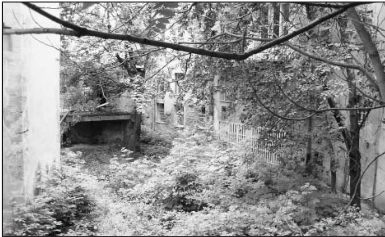
Vodná priekopa pustne a zatiaľ márne čaká na sľubovanú revitalizáciu.