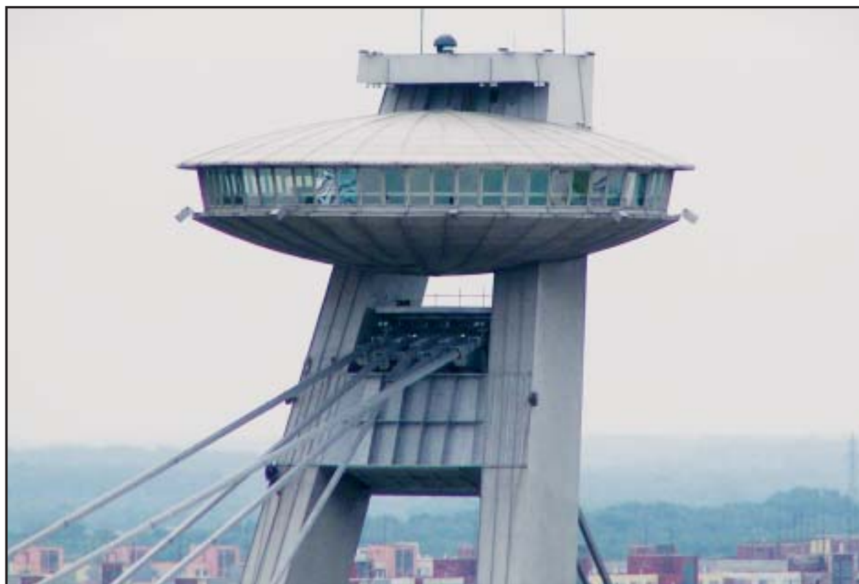
Kaviareň Bystrica sa po rekonštrukcii opäť stane jednou z najväčších atrakcií v meste.

Územie má rozlohu vyše 60 hektárov. Popri areáli dopravného podniku sa tu nachádza aj športový areál, stavebný dvor, záhradky a iné objekty. Väčšina pozemkov patrí mestu. (lau)