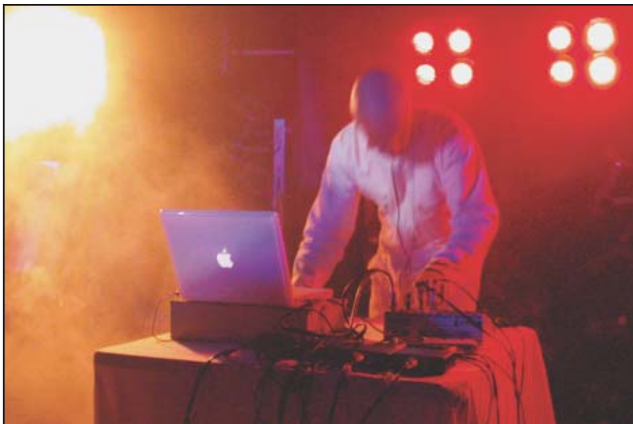
Švajčiarsky „zvukový alchymista“ Mimetic je jedným z ťahákov sobotňajšieho večera hudobného festivalu Resistance .

Bratislavské Noviny najbližšie vyjdú 26. 8.