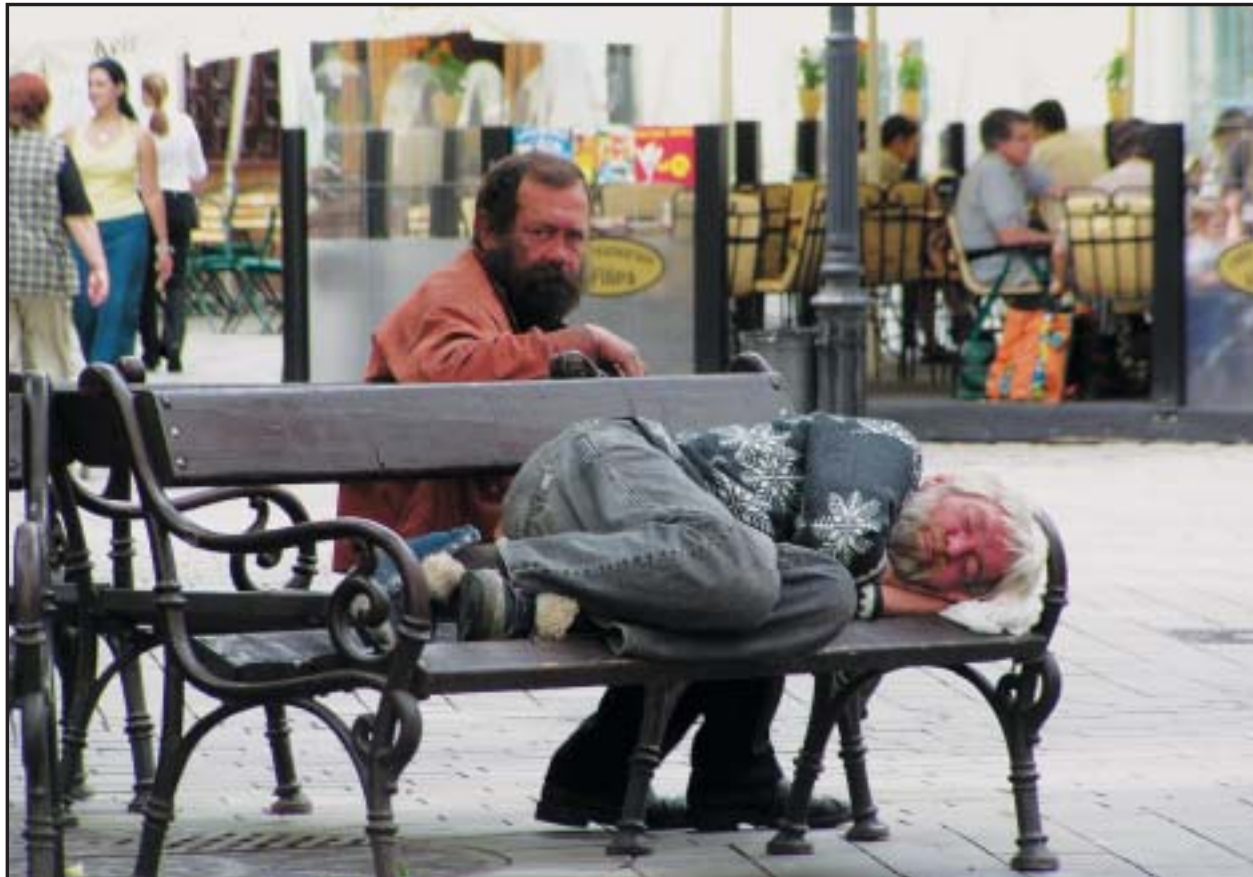
„Bezstarostný život“ bezdomovcov v centre mesta sa čoskoro zrejme skončí.