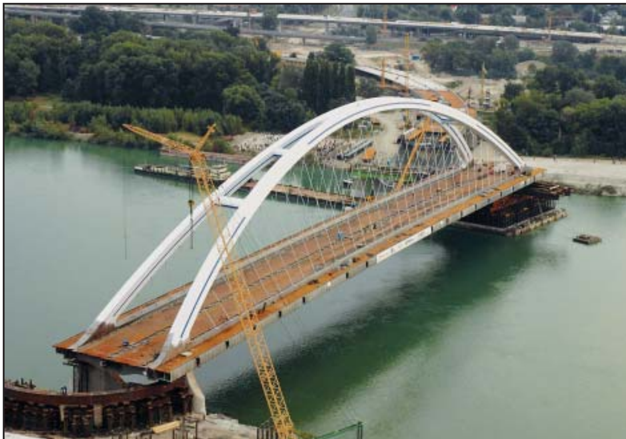
Presun konštrukcie piateho bratislavského mosta cez Dunaj bol najnapínavejšou časťou jeho výstavby.

Anketa potrvá štyri týždne, jej výsledky zverejníme vo štvrtok 21. októbra. (red)