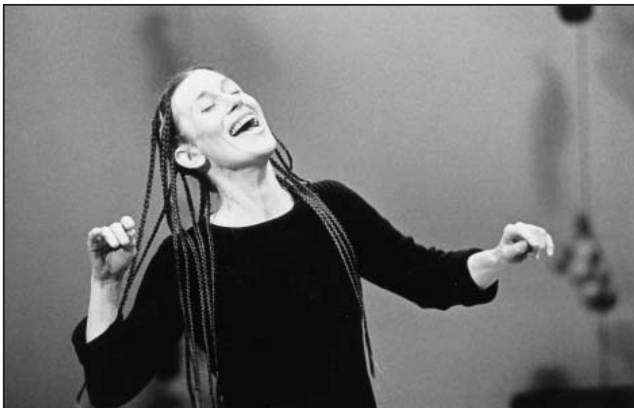
Legendárna americká speváčka a skladateľka Meredith Monk zavíta na Slovensko po prvýkrát.