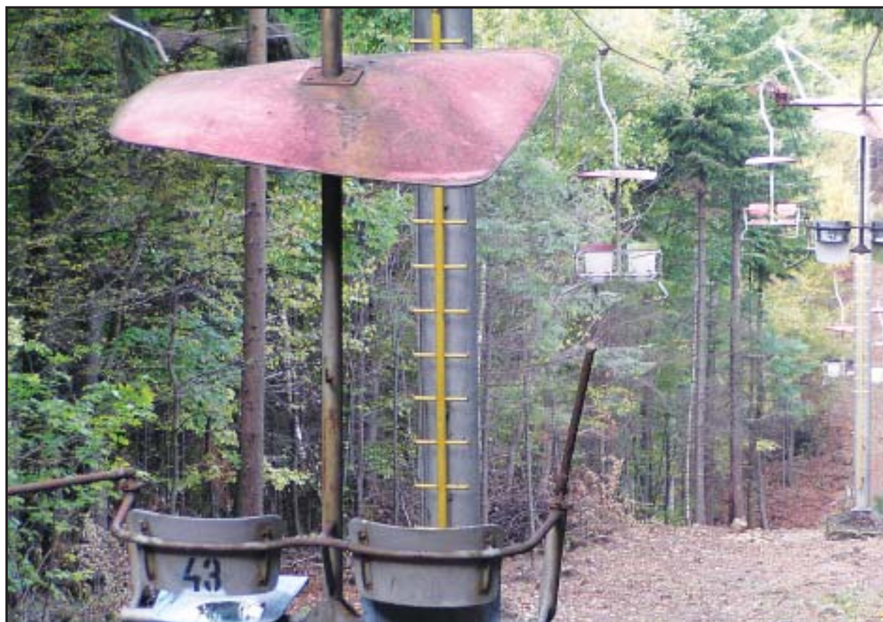
Zdevastovanú lanovku zo Železnej studienky na Kolibu mesto zrekonštruuje.

Počet tých, ktorým sa ani jeden z návrhov nepozdával, nasvedčuje, že bude veľmi náročné vybrať taký názov, ktorý bude mať širokú podporu verejnosti. (red)