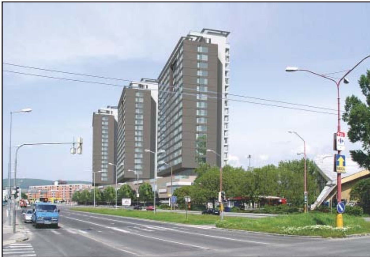
Vedľa športovej haly Elán na Bajkalskej ulici by mali vyrásť takéto tri vežiaky.

NA JUNGMANOVEJ ULICI horelo vozidlo Mercedes Benz. Pri predbežnej ohliadke bolo potvrdené cudzie zavinenie. Vzniknutá škoda sa vyšplhala na 400-tisíc korún. (ver)