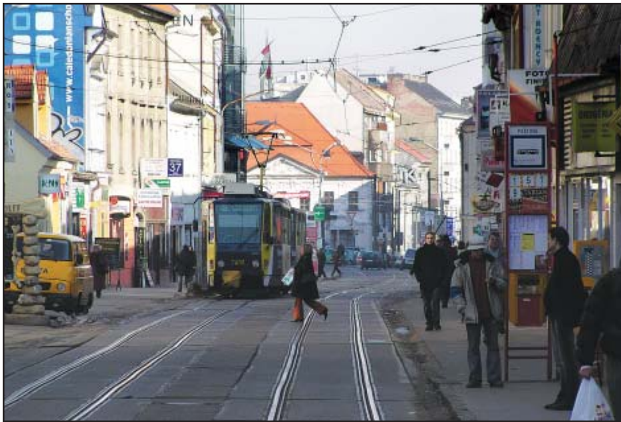
Na Obchodnej ulici sa ráta nielen s obnovou električkovej trate, ale aj s povrchovými úpravami a rozmiestnením prvkov drobnej architektúry.