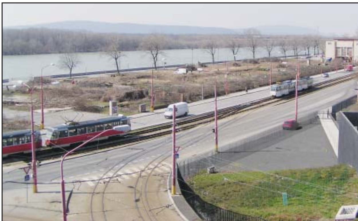
Výrub stromov na dunajskom nábreží bol prvým krokom k začatiu výstavby komplexu River Park.

Podľa M. Sýkora už v priebehu prvých troch týždňov od začatia petičnej akcie sa pod text petície podpísalo vyše 4500 občanov. Petičné hárky v najbližších dňoch odovzdajú členovia petičného výboru zástupcom samosprávy Bratislavy. (lau)