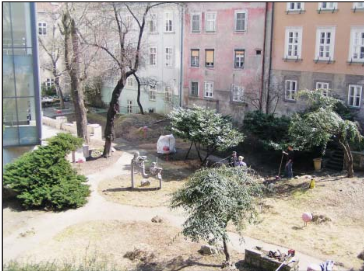
Rekonštrukcii Michalskej (Vodnej) priekopy doteraz bránili najmä problémy s kanalizáciou. Tie sa podujala odstrániť Bratislavská vodárenská spoločnosť, a tak sa práce na obnove priekopy môžu rozbehnúť v októbri.

DPB vznikol v roku 1994 a v rámci Bratislavy vykonáva mestskú hromadnú dopravu. Jediným akcionárom podniku je mesto Bratislava. Spoločnosť zamestnávala v minulom roku v priemere 3200 zamestnancov, ktorých priemerná mzda sa medziročne zvýšila zo 17 792 Sk na 18 801 korún. (ver, sita)