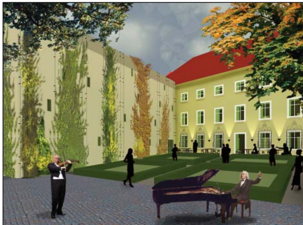
Takto by mala vyzerat' Lisztova záhrada po dokončení rekonštrukcie celého komplexu Univerzitnej knižnice na budúcu jar v roku 2006 podľa projektu architektov J. Bahnu a V. Šimkoviča. VIZUALIZÁCIA - AA atelier, M.Jursa, R. Moravčík

preukazov pre návštevníkov, ktoré budú mať podobu čipových kariet. Evidenčné karty budú mať aj zamestnanci knižnice. Výsledkom rekonštrukcie je „knižničný a informačný supermarket“, kde na troch poschodiach budú mať návštevníci k dispozícii prevažne najnovšiu literatúru a príručkové diela. Nový systém prevádzky umožní široké využívanie moderných informačných, komunikačných a reprografických technológií. Podľa vyjadrenia T. Trgiňu bude knižnica spĺňať všetky požiadavky a zároveň sa podarilo zachovať a obnoviť významné kultúrne pamiatky. (lau)