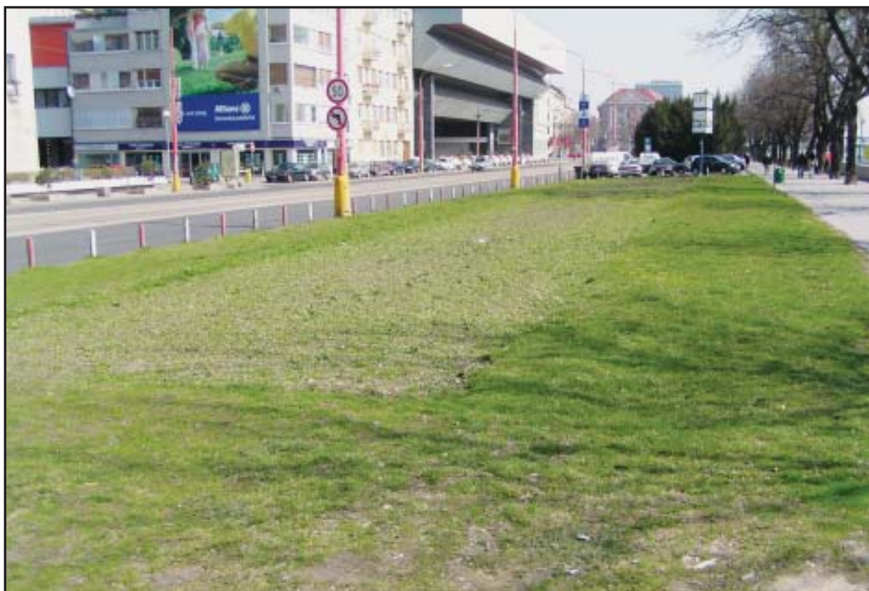
V minulosti na staromestskom nábreží kvitli záhony kvetov, teraz po nich niet ani stopy.