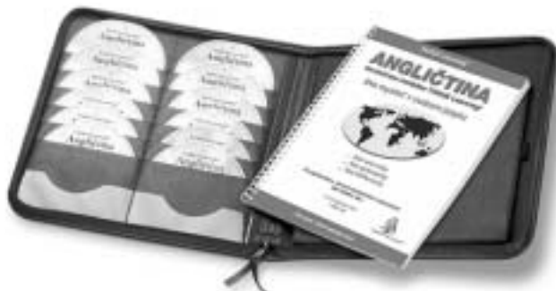
TAXUS Learning® funguje kdekoľvek a u všetkých typov ľudí

Mnohonásobné opakovanie na podvedomej úrovni toho, čo sme už spoznali pri sústredenom učení, náš mozog registruje a