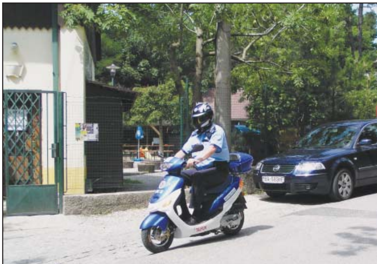
Motorizovaný okrskár mestskej polície od júla dbá o verejný poriadok aj v Horskom parku.

Existujú názory, že priestory Domu odborov nepotrebujú ani tak rekonštrukciu, hoci sú už mierne morálne zastarané, ako skôr dobrý manažment organizovania kultúrnych podujatí, ktorý by do tohto v súčasnosti nedostatočne využívaného zariadenia vdýchol život. Mesto má údaje v tomto smere už určité predbežné predstavy. (juh)