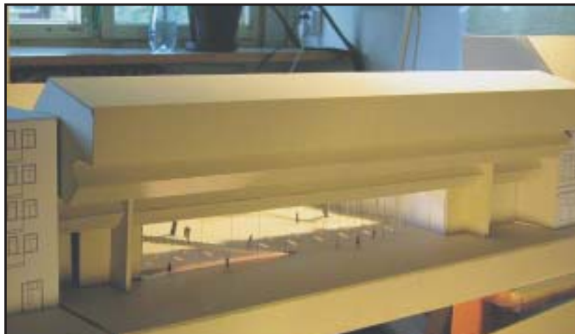
Víťazný návrh ateliéru B.K.P.Š. s väčšími zmenami vzhľadu kontroverzného premostenia Vodných kasární nepočíta.