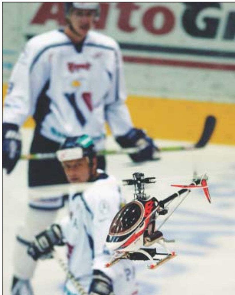
V 2. kole hokejovej extraligy privítal Slovan na svojom ľade MSHK Žilina. Puk na úvodné vhadzovanie priviezla netradične helikoptéra.