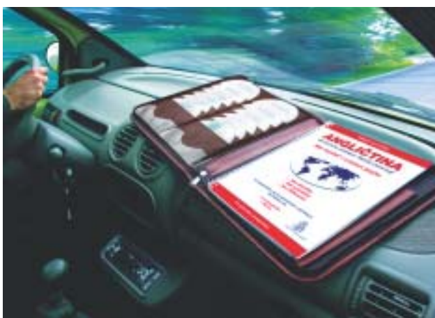
TAXUS Learning® funguje všade a pri všetkých typoch ľudí.

Spozornite! Ako to, že vôbec hovoríte? Premýšľali ste o tom niekedy? Všetci sme sa v škole učili cudzí jazyk, ale 95 % z nás ho neovláda. A ešte si myslíme, že sme hlúpi na jazyky. Lenže to je omyl! Nie sme hlúpi. Pretože keby sme boli hlúpi, naučili by sme sa ani materinský jazyk. Dokonca i mentálne retardovaní jedinci sa naučia hovoriť. Naučiť sa prvý (materinský) jazyk je najťažšie zo všetkých jazykov. Pri učení ďalších totiž môžeme porovnávať nové poznatky so starými.