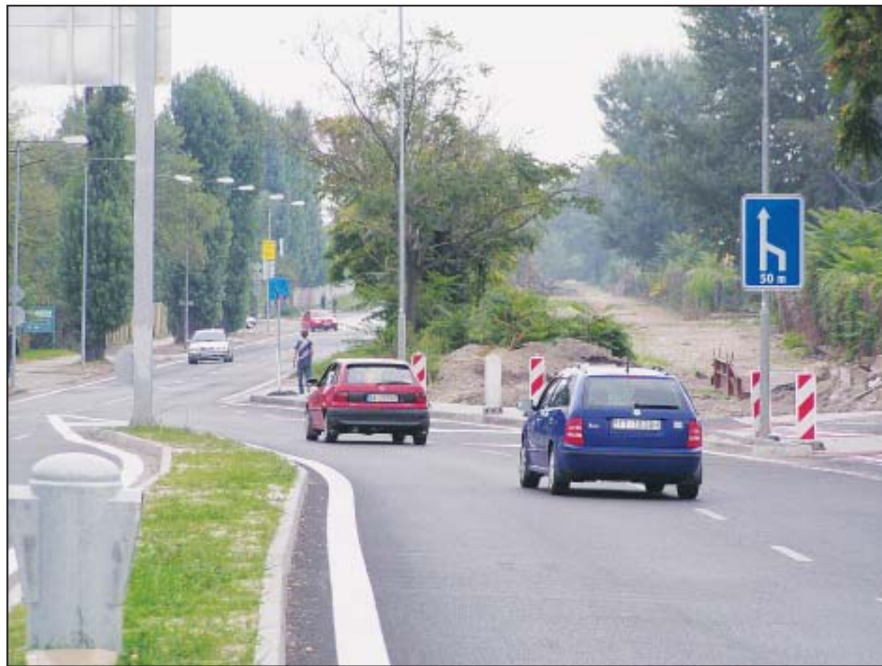
Rozšírenie Prístavnej ulice na štvorprúdovú cestu považuje vedenie mesta za jednu zo svojich priorit. Malo by sa tak stať už na budúci rok - s rozširovaním cesty by sa malo začať v júni a skončiť v novembri 2006.

Najbližší zápas v Lige majstrov čaká bratislavskú Artmediu v stredu 28. septembra v portugalskom Porte proti domácejmu FC. To v utorok prehralo v škótskom Glasgowe s Rangers 2:3. Milánsky Inter hrá 28. 9. doma s Glasgow Rangers. (brn)