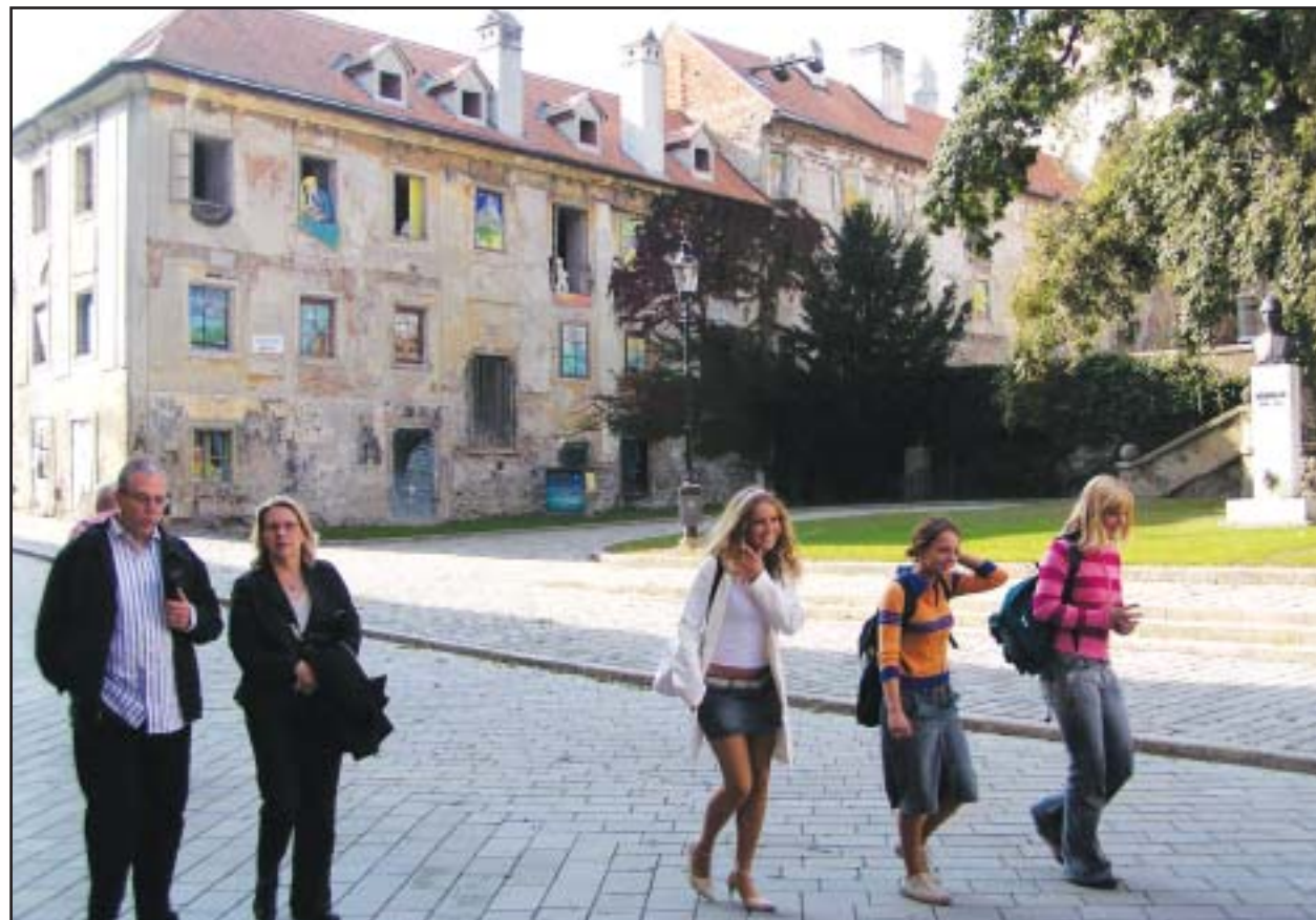
Po rokoch chátrania sa dočká obnovy aj historický dom na Rudnayovom námestí 4. S jeho rekonštrukciou chce samospráva mesta začať už v novembri.

Je tu uzatvorený pravý odbočovací pruh z Molecovej do Karloveskej ulice a pravý jazdný pruh od Molecovej po Devínsku cestu v dĺžke 150 metrov. Obchádzkové trasy sú vedené po vedľajších jazdných pruhoch. Prvý z týchto úsekov bude uzatvorený do 2. novembra, druhý až do 15. novembra. Obe uzávierky súvisia s prácami na systéme preferencie električkovej dopravy na Karloveskej radiále a v oboch úsekoch pribudne cestná svetelná signalizácia. Ako sme už informovali, systém preferencie električkovej dopravy spočíva v tom, že križovatky budú zapojené do súvislého radu dynamicky riadených križovatiek. Vodiči električiek si budú môcť špeciálnymi zariadeniami diaľkovo nastaviť cestnú svetelnú signalizáciu tak, aby v okamihu, keď prechádzajú križovatkou, mali voľný prejazd. Dynamické riadenie križovatiek s preferovaným vyvolávaním zelenej pre električky umožní bezkolízny prejazd električiek s minimálnym alebo žiadnym zdržaním. (juh)