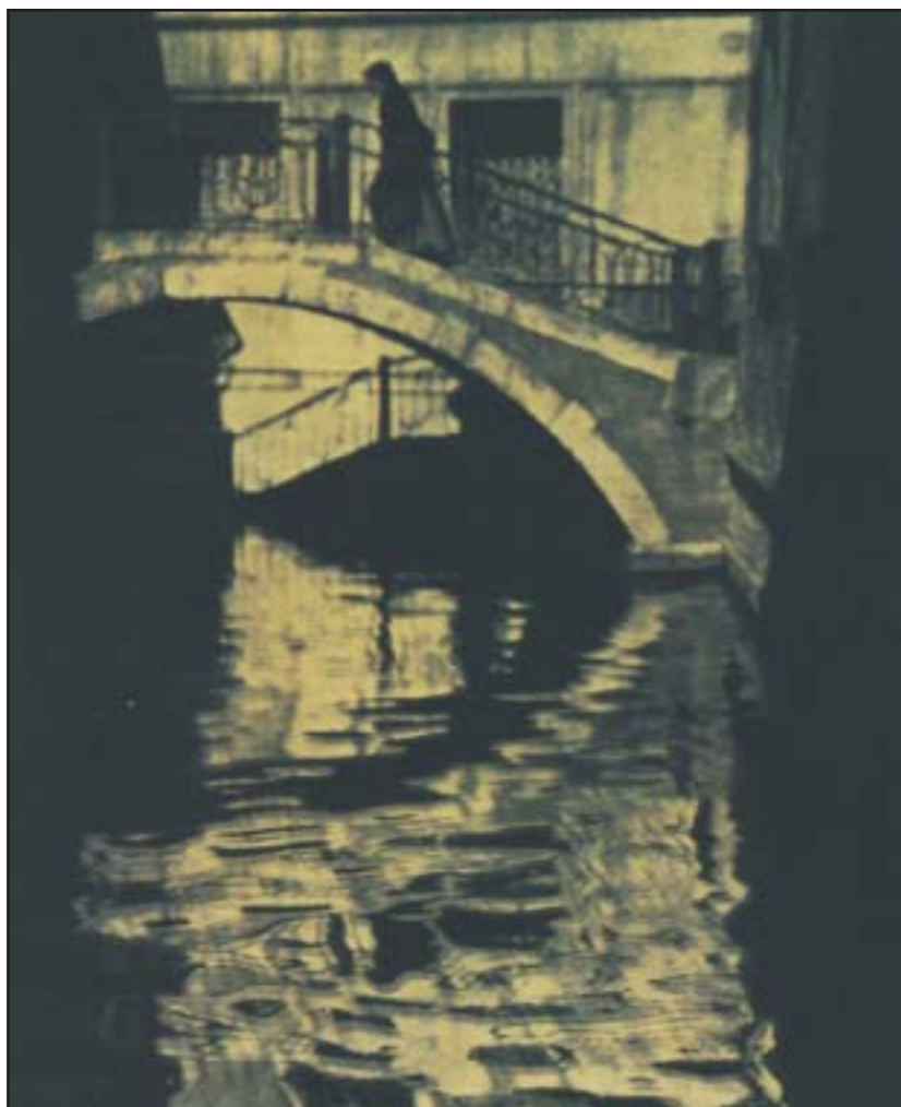
Na výstave nechýba ani fotografia Benátsky most, ktorá bola publikovaná v časopise Camera Work ešte v roku 1908.