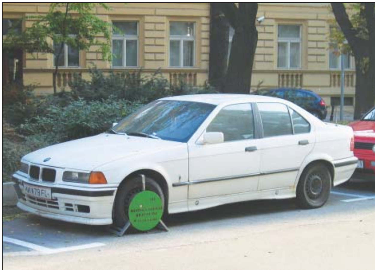
Nie je vylúčené, že majiteľ bieleho BMW s rakúskym evidenčným číslom v obave pred krádežou vozidla dal pri návšteve Bratislavy prednosť bezpečnému parkovaniu za asistencie mestskej polície.

Verejnosť by sa mohla upokojiť, že sa nič vážneho nedeje. Vážne nie je ani strata spôsobená na parkovnom. Vážne je len to, že toto auto za mesiac znemožnilo na chvíľu zaparkovať svoje auto desiatkam iných vodičov. Gustav Bartovic