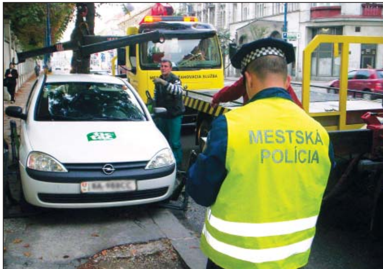
Plánované organizačné začlenenie Mestskej polície do Policajného zboru sa napokon neuskutoční a zmeny v práci mestských policajtov nebudú také radikálne, ako sa pôvodne predpokladalo.

Tie ešte predtým prevalcovali koniara a rozbehli sa do lesa. Muž okamžite informoval príslušné pracovisko mestskej polície a začala sa pátracia akcia. Z lesa sa však kone dostali na Pražskú ulicu a nasmerovali si to rovno do mesta. Vzhľadom na hustú cestnú premávku hliadky cválajúce kone nemohli odchytiť. Ako uviedol Pleva, kone sú síce cvičené, no pri odchyťavani sa mohli splášiť a spôsobiť dopravné kolízie. Vhodným miestom sa ukázal až priestor pred Národnou bankou Slovenska a Technickou univerzitou, kde nehrozilo nebezpečenstvo ani pre vodičov, ani pre chodcov. Krátko pred pol ôsmou boli už zvieratá pod kontrolou mestských policajtov a po ôsmej hodine ich začali dopravnými prostriedkami odvážať späť do ich „domova“. Kone nespôsobili dopravný chaos, dopravné nehody a ani nikoho nezranili. (sita)