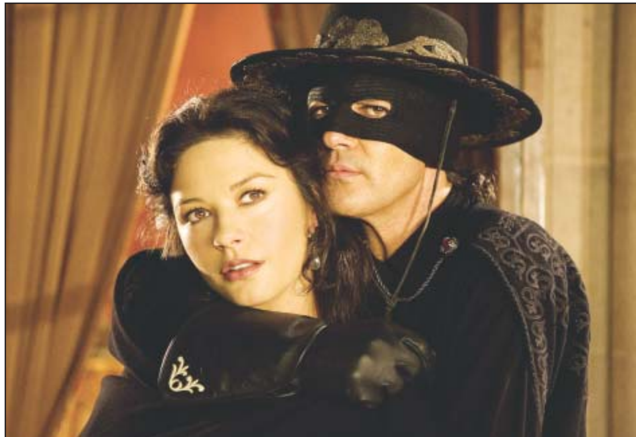
Aj v pokračovaní príbehu o Zorovi stvárnil hlavné postavy Catherine Zeta-Jones a Antonio Banderas.