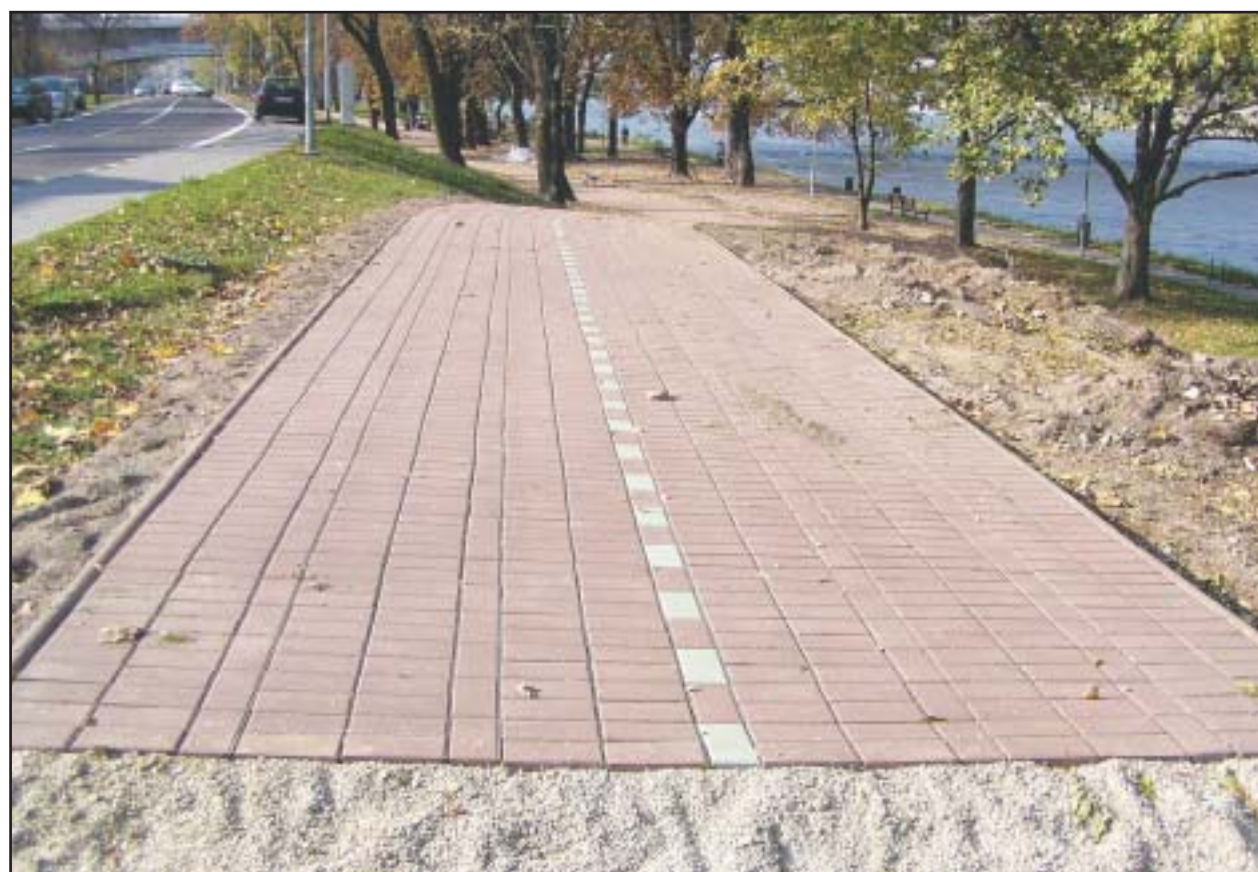
Kilometrový úsek cyklotrasy od Nového po Starý most bude stáť 7,5 milióna korún.

Budovaním tejto cesty vlastne Správa rekreačných zariadení prechádza do realizáčnej fázy starostlivosti o cyklistické cesty. Táto kompetencia bez pasportizácie im spadla do lona síce už pred piatimi rokmi, prvý pokus o výstavbu však v roku 2002 pretrhla povodeň, potom bolo treba čakať na rozhodnutie, ako sa stará Viedenská cesta upraví z hľadiska protipovodňovej ochrany. V týchto dňoch dokončia prvé dva úseky, zostávajúce tri budú stavať na rok, paralelne s tým, ako sa budú realizovať na tomto úseku protipovodňové opatrenia. Gustav Bartovic