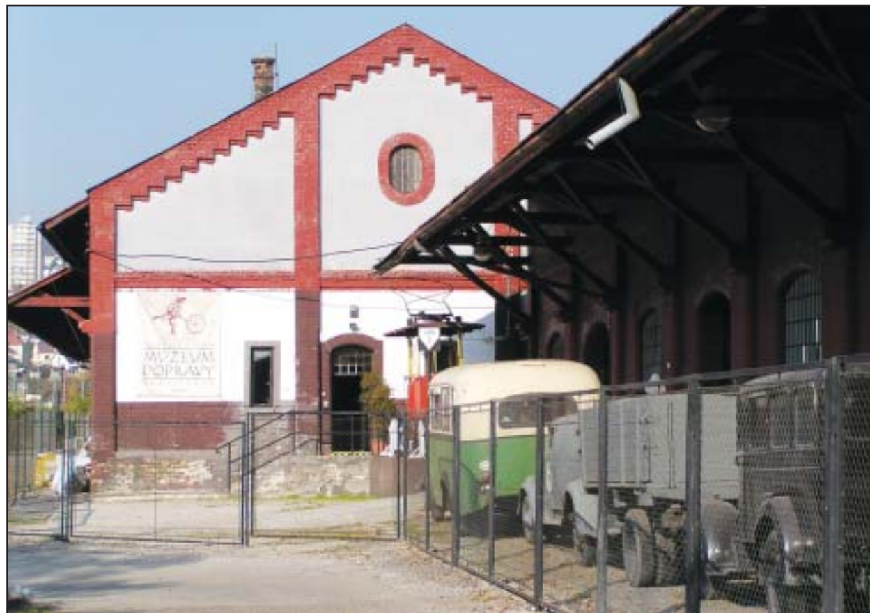
Skladu II, kde sídli časť expozície Múzea dopravy, hrozí zbúranie. Stojí totiž na mieste, kadiaľ by mala viesť mimoúrovňová cesta, ktorú plánujú vybudovať v rámci kompletnej prestavby Predstaničného námestia.

Skóre zápasu otvoril už v 3. minúte hosťujúci Pršo, no už o päť minút vyrovnával na 1:1 kapitán domácich Borbély. Škótsky majster sa opäť ujal vedenia v 44. minúte, keď hlavičkoval za Čobejev chrbát Thompson. Petržalčanom sa podarilo vyrovnať v 59. minúte, keď chybu brankára Waterreusa využil Kozák. Oba tímy tak majú v tabuľke naďalej rovnaký počet bodov aj skóre. Najbližšie sa Artmedia Bratislava predstaví 23. novembra na milánskom San Sire proti domácomu Interu. FC Porto v ten istý deň privíta Glasgow Rangers. (brn)