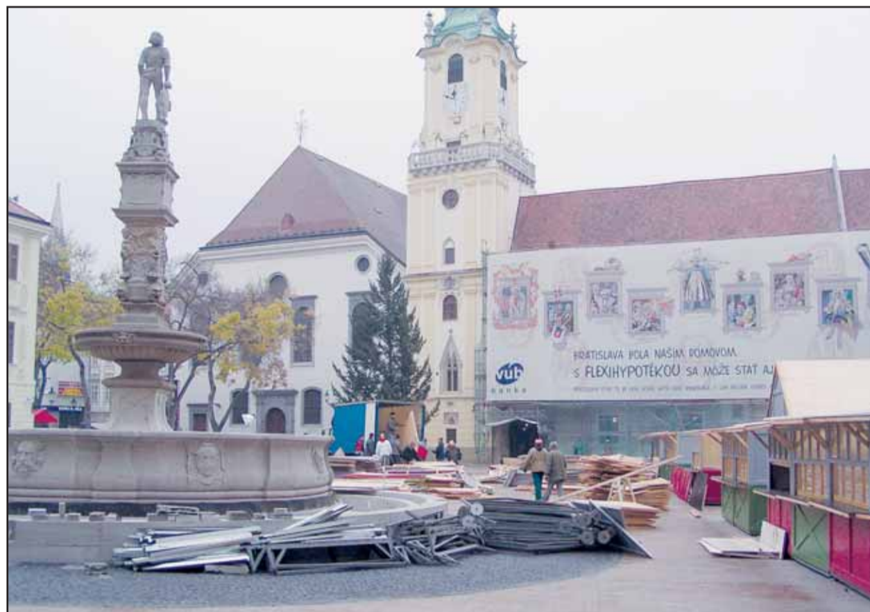
Prvá etapa obnovy povrchu Hlavného námestia sa skončila načas, a tak prípravám na tradičné vianočné trhy na tomto centrálnom bratislavskom námestí už nič nebráni.

Do budúročného rozpočtu sú zaradené aj náklady na opravu budúceho sídla úradu samosprávneho kraja na Drieňovej ulici vo výške 152 miliónov korún. Rekonštrukciu bude samospráva hradíť sčasti z vlastných zdrojov, približne 90 miliónov korún však bude tvoriť investičný úver a po prvýkrát sa tak do rozpočtu BSK zapoja aj čerpanie úverových zdrojov. Ako Roman dodal, „návrh rozpočtu je dokument, ktorý tu ako východisko zanecháme pre budúce zastupiteľstvo, má však možnosť zmeniť ho podľa vlastných priorít.“ (sita)