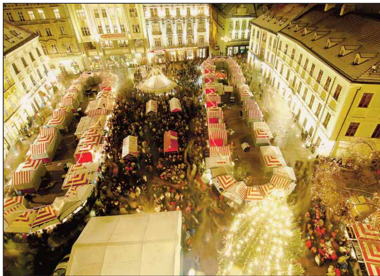
Atmosféru tohtoročných Vianočných trhov umocňuje nové osvetlenie Hlavného námestia.

Nová anketová otázka znie: Páčia sa vám Vianočné trhy na vynovenom Hlavnom námestí? Výjadriť sa môžete na www.bratislavskenoviny.sk. Anketu vyhodnotíme v poslednom tohtoročnom vydaní novín 15. decembra. (red)