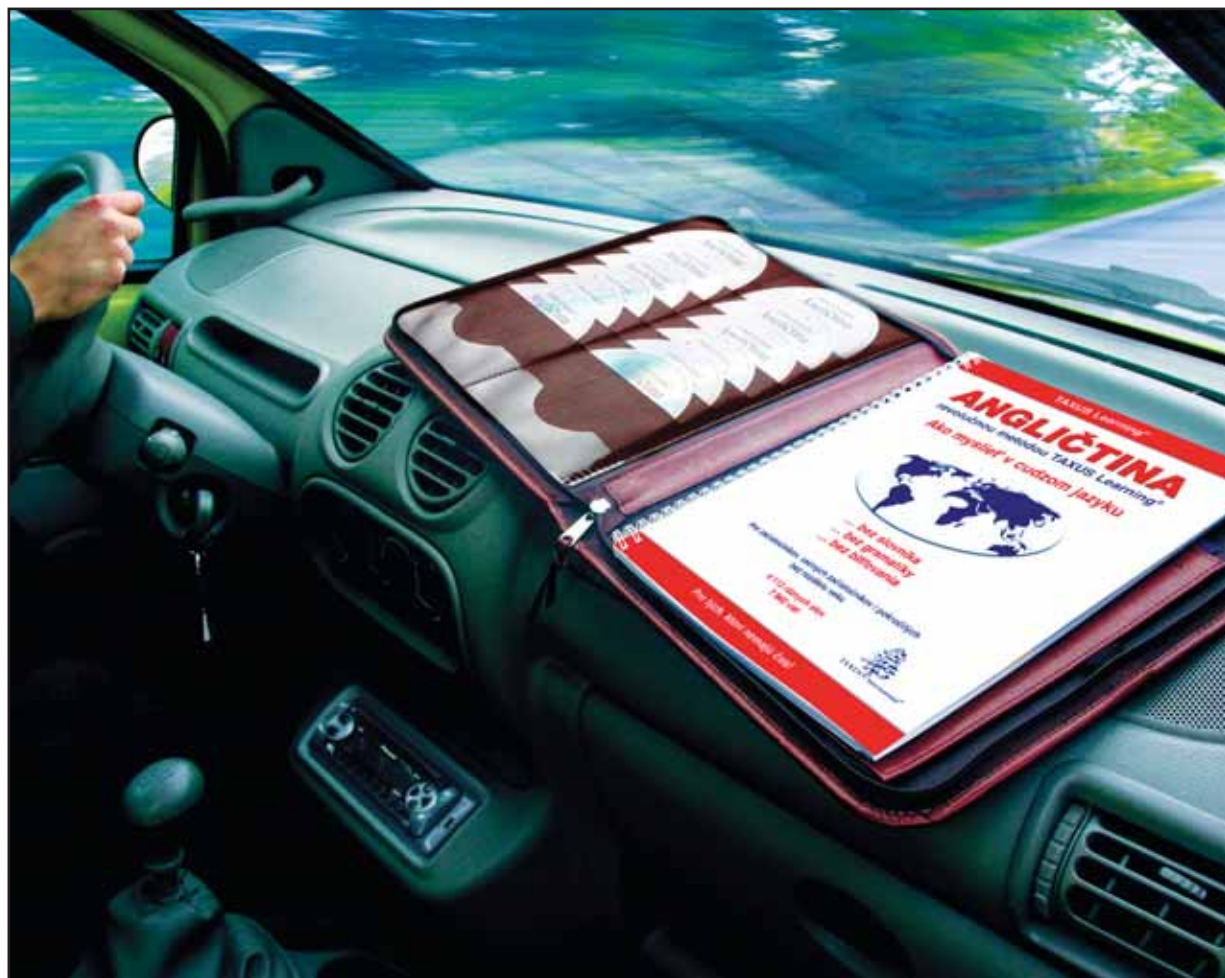
TAXUS Learning® funguje všade a pri všetkých typoch ľudí.

Ak sa vám niečo zdá nadsadené, potom vedzte, že iba naše „racionálne“ školstvo v nás vypestovalo pozna-