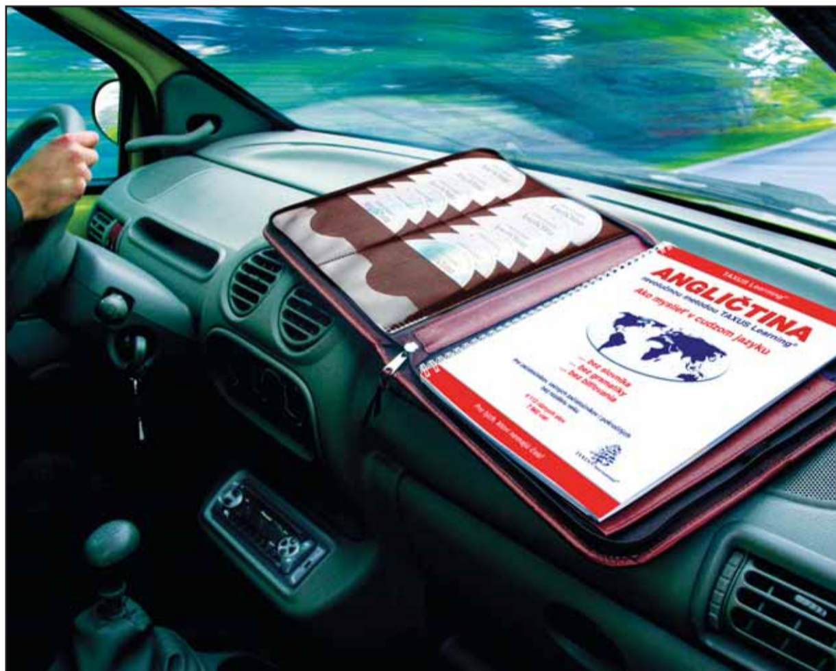
TAXUS Learning® funguje všade a pri všetkých typoch ľudí.

Ak sa vám niečo zdá nadsadené, potom vedzte, že iba naše „racionálne“ školstvo v nás vypestovalo pozna-