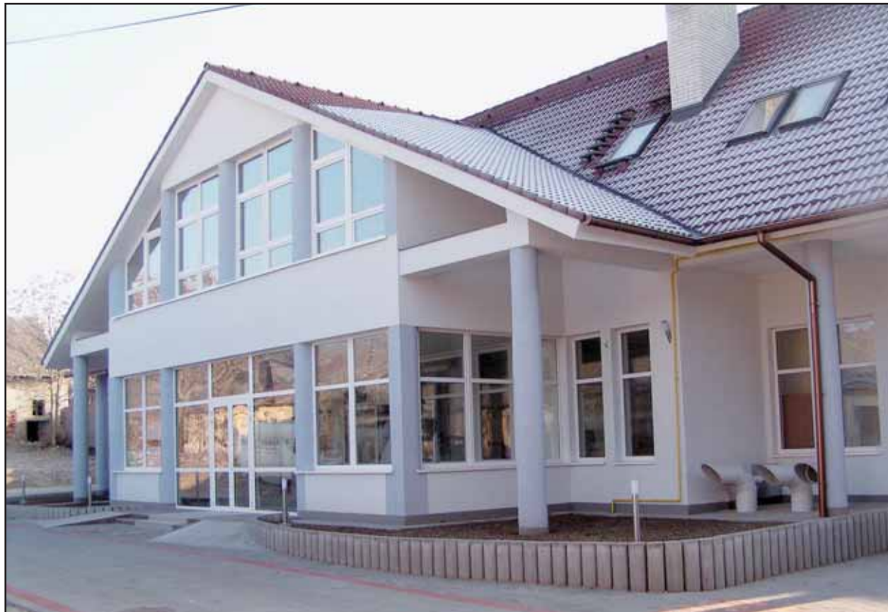
Chorvátske múzeum SNM bude pre verejnosť otvorené až od 6. januára.

Najväčšiu skupinu - 670 ľudí - predstavujú starší, zväčša osamelí obyvatelia mestskej časti Bratislava - Nové Mesto, starší ako 60 rokov a s dôchodkom pod 7200 korún. (gub)