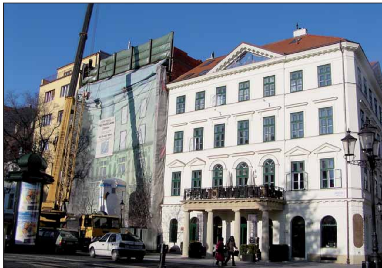
V závere decembra a začiatkom januára pribudli na rekonštruovanom dome na Hviezdoslavovom námestí 25 dve podlažia, na ktoré stavebník nemá stavebné povolenie. Priamo v centre Bratislavy tak vyrastá čierna stavba.

Na január sme pre čitateľov Bratislavských novín pripravili internetovú anketu s novou otázkou: Ako hodnotíte klzisko so syntetickým povrchom na Hviezdoslavovom námestí? Reagujeme tým na diskusiu, ktorú vyvolalo rozhodnutie staromestskej samosprávy nahraďiť verejné klzisko s ľadovou plochou na Hviezdoslavovom námestí suchou alternatívou v podobe klziska s plastovou plochou. Reakcie čitateľov Bratislavských novín sú zatiaľ negatívne, oproti minulosti je o korčuľovaní na Hviezdoslavovom námestí výrazne nižší záujem, nie sú ojedinelé ani prípady, keď býva klzisko prázdne. Ak ste sa na tejto plastovej ploche skúsili korčuľovať, vyjadrite sa v internetovej ankete na stránke www.bratislavskenoviny.sk , či je klzisko so syntetickým povrchom lepšie ako ľad, rovnaké alebo horšie ako ľad. (red)