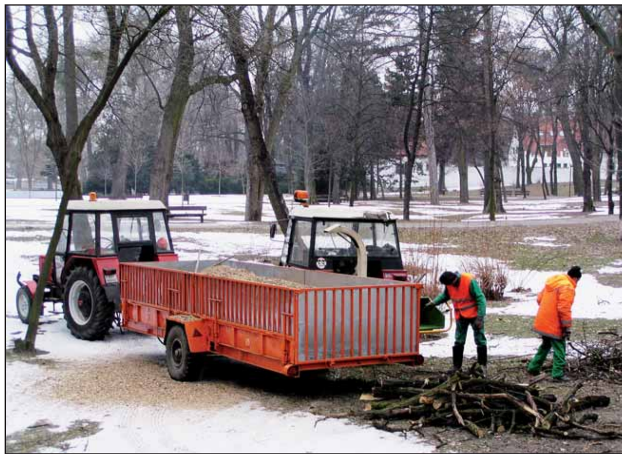
V Sade Janka Kráľa sa v uplynulých dňoch začalo s výrubom chorých stromov.

V piatok ráno našli cestujúci na zástavke verejnej dopravy na Zochovej ulici stuhnuté telo asi štyridsaťročnej ženy, ktorej už nebolo pomoci. Policajti zisťujú jej totožnosť. Takmer zhodný je aj druhý prípad z konca týždňa, keď v opustenom dome nad sídliskom v Lamači našli zmrznutého približne rovnako starého neznámeho muža. (gub)