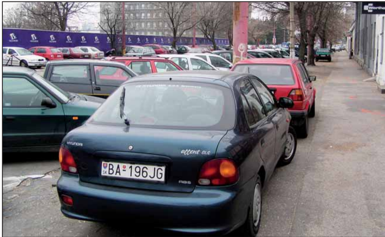
Nedostatok parkovacích miest v centre mesta riešia niektorí motoristi na úkor chodcov.

renská - Prístavná - Pribinova - Karadžičova - Legionárska). Zóna C2 - Vajnorská zahŕňa územie ležiace okolo Vajnorskej ulice od Šancovej po Tomášikovu ulicu. Návrh ďalej ráta s vytvorením tzv. okrskových centier v územiach, kde narastá prevaha komerčných aktivít nad rezidenčnými. Zohľadňuje existenciu obytných oblastí, kde regulácia (spolplatenie) uličného parkovania nie je vzhľadom na dominanciu obytnej funkcie vhodná. Pokiaľ ide o rekreačné oblasti (Železná studnička, Koliba - Kamzík, Petržalka - nábrežie, Sad J. Kráľa, Podunajská hrádza od Nového mosta po mestskú časť Čunovo a Vodné dielo Čunovo), regulácia parkovania by sa mala riešiť lokálne. Návrh obsahuje aj zásady riešenia statickej dopravy v jednotlivých mestských častiach. (juh)