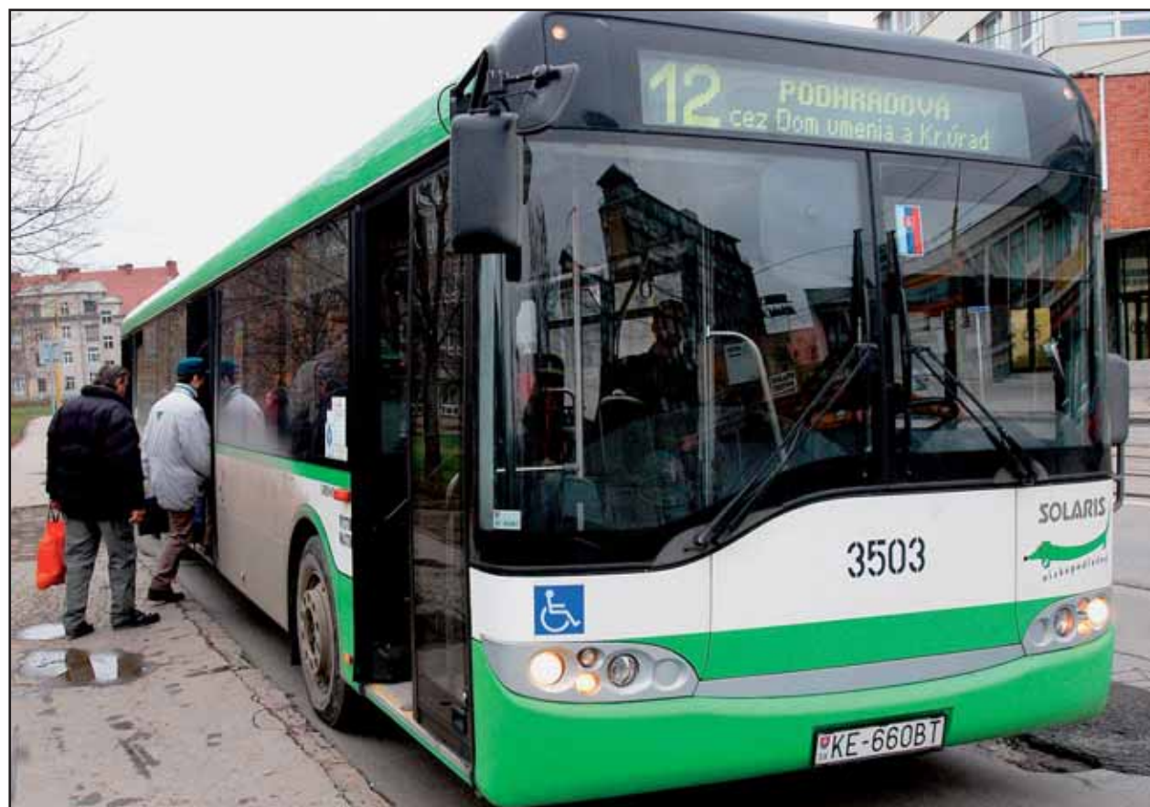
Poľské nízkopodlažné autobusy Solaris Urbino už jazdia v Košiciach, v bratislavských uliciach by sa prvé z nich mali objaviť v auguste.

Vedenie spoločnosti v súčasnosti rokuje s mestom a Dopravným podnikom Bratislava aj o možnosti využívať zástavky MHD. Mikrobuse nemajú stanovený grafikon, budú premávať nepretržite od 6.00 do 18.00 h. Cestovné má byť jednotné - 25 korún. Vozidlá budú brať výlučne cestujúcich na sedenie, ich kapacita je štrnásť osôb. Gustav Bartovic