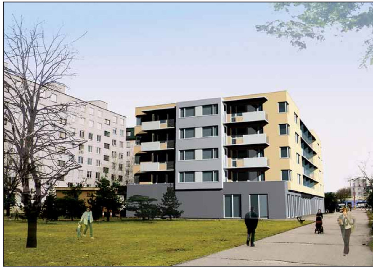
Takto by mal vyzerat' nový polyfunkčný objekt na Súmráčnej ulici, z výstavby ktorého majú obavy obyvatelia existujúcej osempodlažnej bytovky (v pozadí). VIZUALIZÁCIA - Ing. arch. Ján Pavúk

Aby vyšli starousadlíkom ešte viac v ústrety, rozhodli sa piate podlažie postaviť ako ustupujúcu časť, takže sa predĺži čas, keď bude slnko svietiť na susedné domy. (gub)