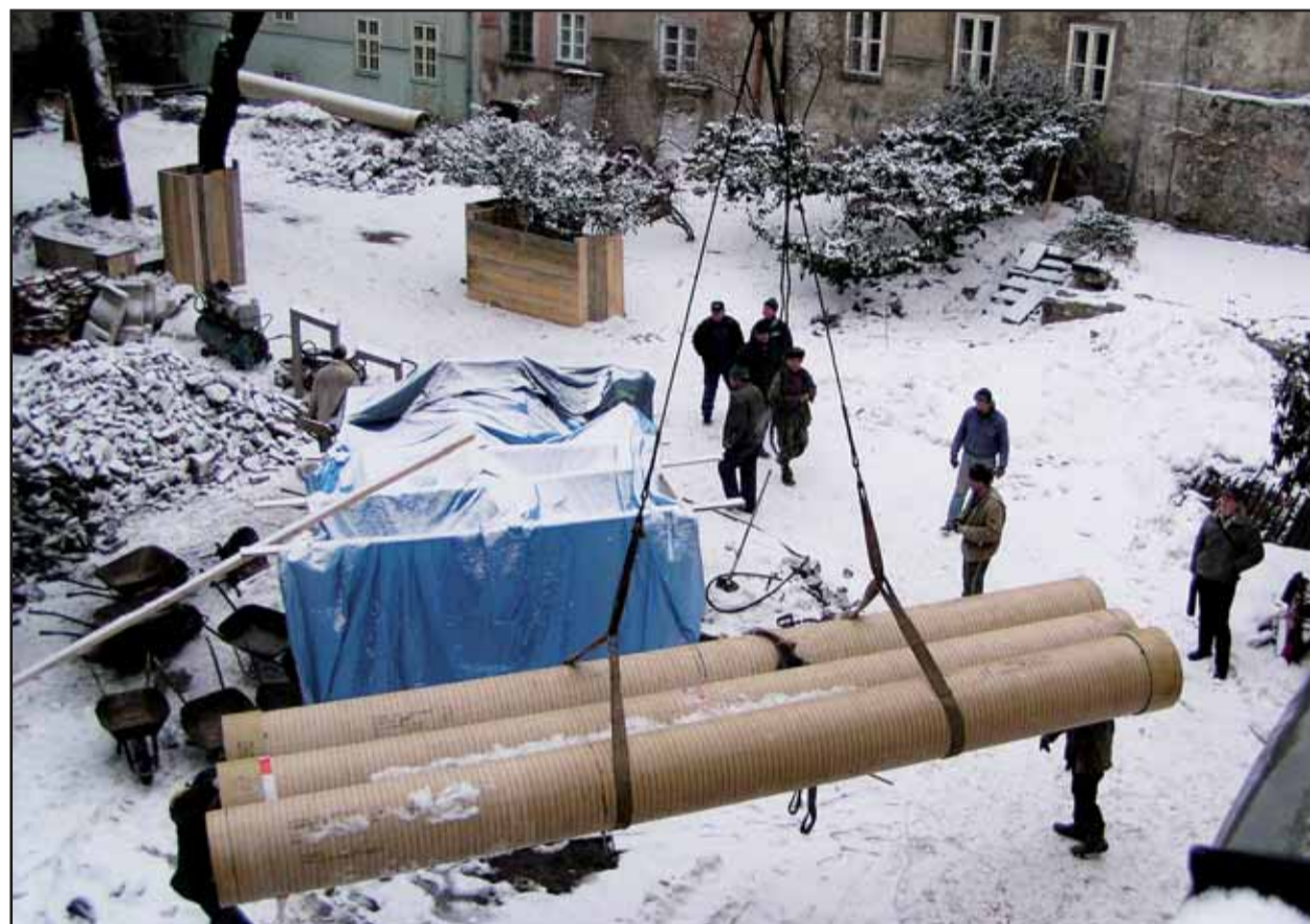
Obnovou kanalizácie a vodovodu sa v uplynulých dňoch začali práce na revitalizácii Michalskej priekopy v časti od jej premostenia po obchodný dom Alizé a Prašnú baštu.

Magistrát uzavrie zmluvu s firmou, ktorá bude robiť údržbu výťahov. V prípade poruchy by mali technici na miesto doraziť do 20 minút. Štyri výťahy na ľavom brehu Dunaja mali byť pôvodne spustené už vlni v októbri. Zdržanie spôsobilo ich zabezpečenie proti vandalom. Špeciálne nerezové plechy doručili z Fínska poškodené a museli ich reklamovať. Predpokladá sa, že výťahy budú slúžiť najmä telesne postihnutým. Každý z nich má kapacitu osem osôb. (brn)