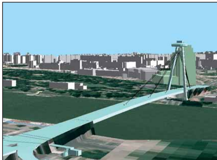
Aupark Tower zásadne zmení panorámu pravého brehu Dunaja, čo potvrdzuje aj toto vizuálne porovnanie. ORTOFOTOMAPA + 3D MODEL - Eurosense, s.r.o.