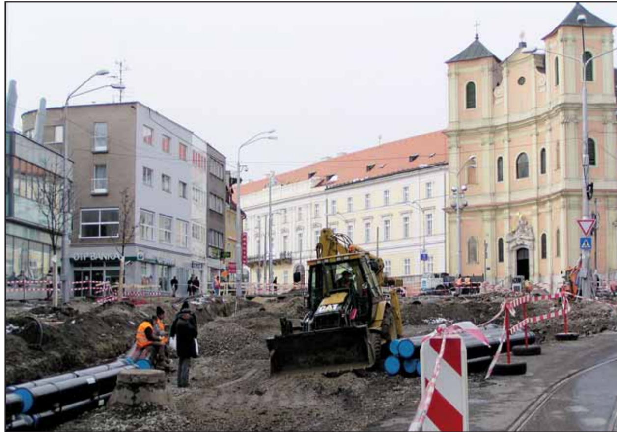
Rekonštrukcia Hrubanovho námestia zásadným spôsobom zmenila organizáciu dopravy v tejto časti Starého Mesta. Tento stav potrvá do začiatku mája, keď má byť obnova námestia dokončená.

Primátor mesta spomedzi nich vyberie štyri osobnosti, ktorým cenu odovzdá. Ceny primátora hlavného mesta SR Bratislavy budú slávnostne odovzdané v piatok 21. apríla od 19.00 h v Zrkadlovej sieni a v ďalších reprezentatívnych priestoroch Primaciálneho paláca - historickej radnice hlavného mesta. (mih)