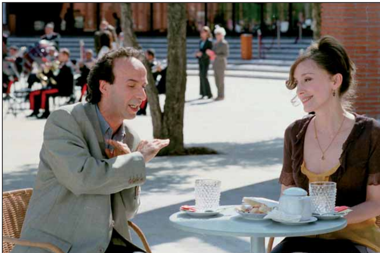
Protagonistami nového Benigniho filmu sú samotný Roberto Benigni a Nicoletta Braschi.

Skupina Preßburger Klezmer Band si za základ svojho repertoáru vybrala hudbu štýlu klezmer (t.j. ľudovú hudbu východoeurópskych Židov), ktorú však dotvára vlastnou interpretáciou, originálnymi aranžmánmi a kombinuje s inými hudobnými štýlmi a žánrami. Takto možno v jej podaní cítiť nielen „čistý“ klezmer, ale aj prvky džezu, reggae, latino, slovenského, cigánskeho a balkánskeho folklóru či nádych Orientu. Inak povedané - emotívna a tanečná muzika. Po koncerte kapely sa v priestoroch DK Zrkadlový háj uskutoční veľká tanečná párty, na ktorej vystúpia súčasní a bývalí členovia Preßburger Klezmer Band v projekte 3MRACE feat. virtual klezmer stars, DJ SHMUEL a hostia zo Srbska a Čiernej Hory. (dš)