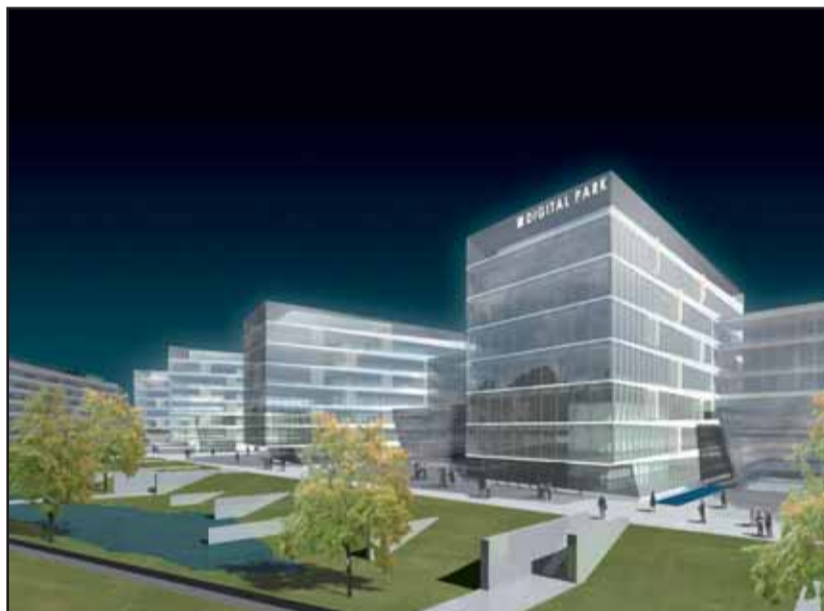
Na rozdiel od pôvodných zámerov zmenený projekt Digital Parku už neráta s výstavbou výškovej budovy. VIZUALIZÁCIA - Cigler Marani Architects

bude vnútri areálu vyúsťovať na úroveň terénu, pretože päť nových objektov bude v teréne posadených asi o úroveň jedného podlažia nad okolie.