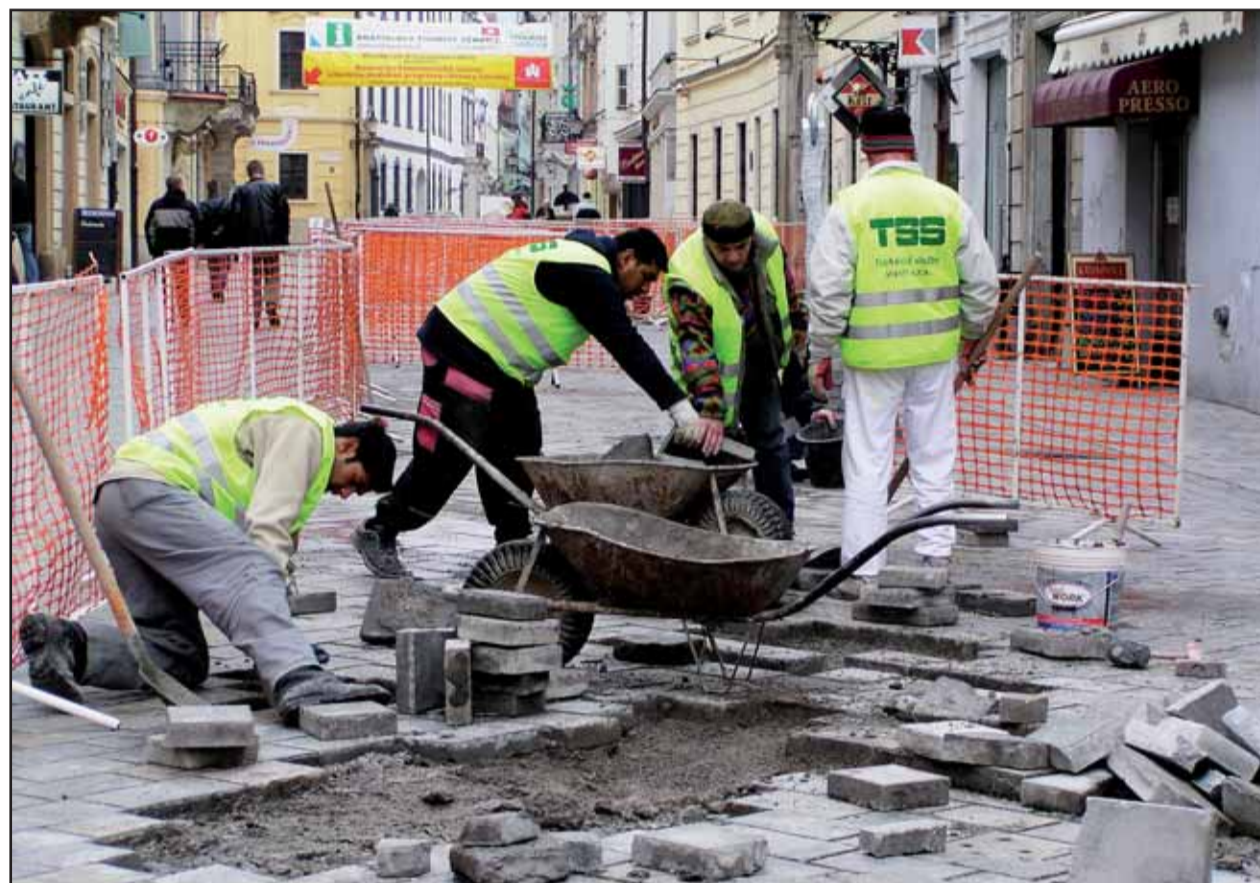
Z iniciatívy bratislavského magistrátu sa konečne začalo s obnovou dlažby v pešej zóne historického centra Starého Mesta. Zničená dlažba má byť opravená do 20. apríla, práce budú stáť 1,5 milióna korún.

Aprílová otázka internetového vydania Bratislavských novín znie: Súhlasíte so zámerom premostiť Staromestskú ulicu a prepojiť tak historické centrum s Hradom? O zámere premostenia Staromestskej ulice informujeme na 2. strane, bližšie sa téme budeme venovať v budúcom vydaní novín. Hlasovať môžete na www.bratislavskenoviny.sk . (ado)