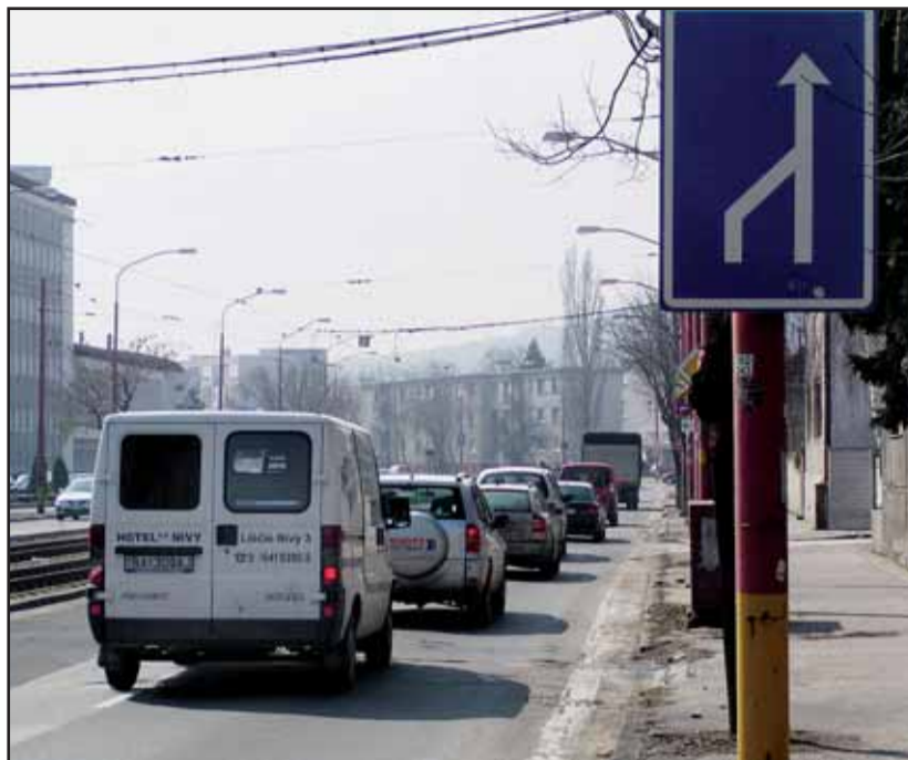
Račiansku ulicu by mali rozšíriť aj pri Bielom kríži.

„Pre úplnosť treba dodať, že súčasťou tohto rozšírenia je i vybudovanie samostatného pruhu pre pravé odbočenie z Račianskej na Pioniersku ulicu, ktoré priamo súvisí s očakávaným zvýšením intenzity automobilovej dopravy po uvoľnení spomenutých dopravných lievikov,“ upo-