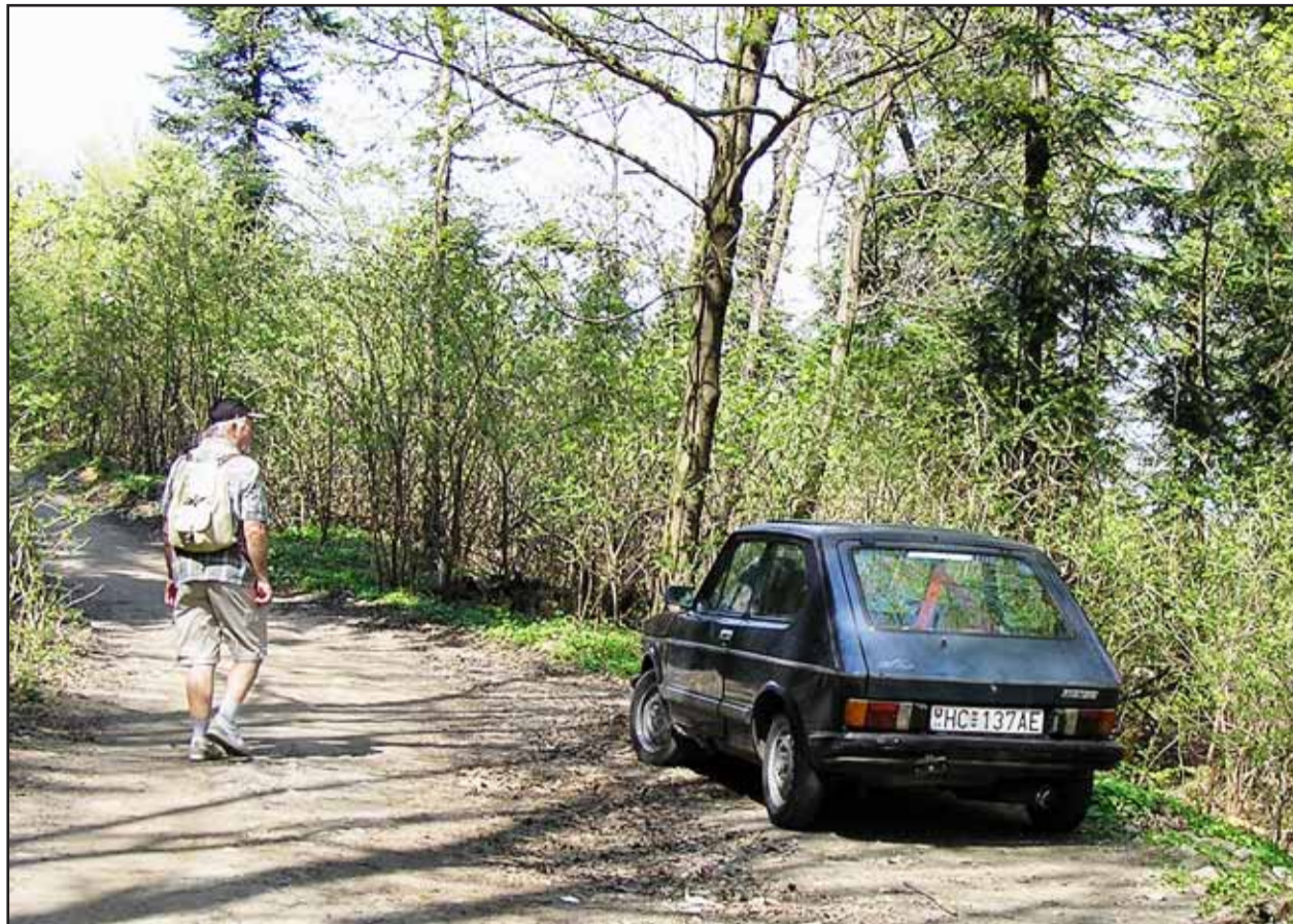
Nedisciplinovaní vodiči nemajú zábrany a parkujú aj na lesných chodníkoch pod Kamzíkom.

Bytový dom je 9-podlažný s jedným podzemným podlažím s odovzdávacou stanicou tepla a elektrickou rozvodňou. Je rozdelený na dva celky - časť A chodbového typu a B schodišťového typu. Prístup do objektu je z Tománkovej ulice. Celková plocha bytov je vyše 5473 štvorcových metrov. V objekte domu je 12 garážových stání na jednom nadzemnom podlaží, celkový počet parkovacích stání je 85, z toho tri sú vyhradené pre telesne postihnutých. Súčasťou stavby sú aj obslužná komunikácia, chodníky, spevnené plochy, parkovacie miesta, osvetlenie, prípojky inžinierskych sietí, kontajnerové stojiská, sadové úpravy, detské ihrisko a oporné múry, ktoré bolo potrebné vybudovať vzhľadom na náročný svahovitý terén. (juh)