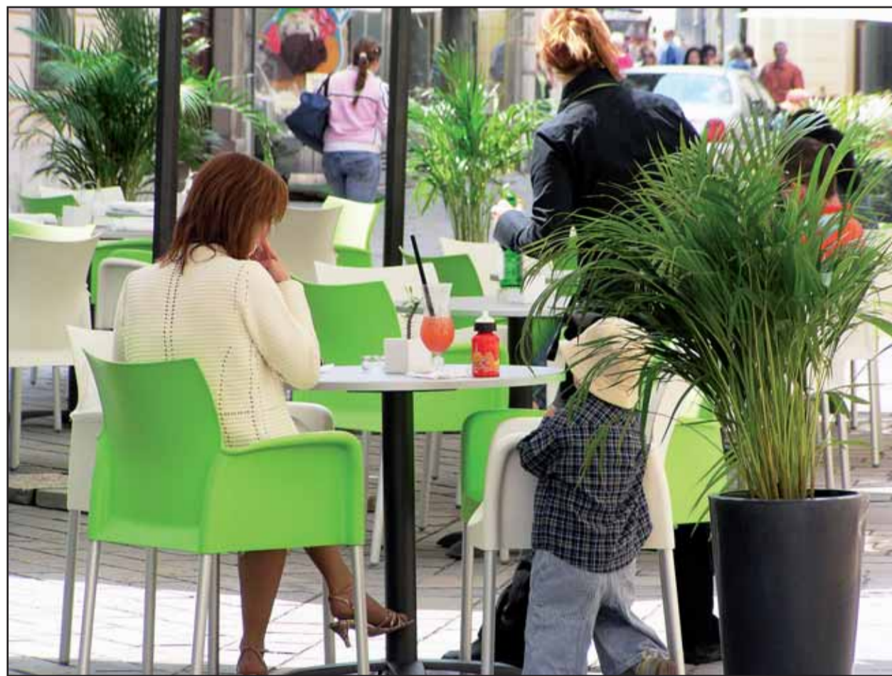
Niektoré terasy na korze poskytujú príjemné posedenie, iné strpčujú chodcom život. ILLUSTRÁČNÉ FOTO - Oto Limpus

Od 20. apríla je čiastočne uzatvorená Prievozská ulica v dĺžke 80 metrov pre poruchu vozovky spôsobenej stavebnou jamou na príslušnom pozemku; uzávierka potrvá do 20. júna. Od 20. apríla je tiež z dôvodu stavebných úprav v rámci výstavby cestnej svetelnej signalizácie zmenená organizácia dopravy v križovatke Devínska cesta - Karloveská ulica. Čiastočne uzatvorená je Karloveská ulica v ľavom jazdnom pruhu v smere do mesta v dĺžke 50 - 60 metrov od križovatky s Devínskou cestou a v ľavom jazdnom pruhu v smere z mesta v dĺžke 100 metrov od križovatky s Devínskou cestou. Na Devínskej ceste je úplne uzatvorený pravý jazdný pruh v smere do mesta v dĺžke 85 metrov od vyústenia na Botanickú ulicu a ľavé odbočenie z Devínskej cesty do Karloveskej ulice. (juh)